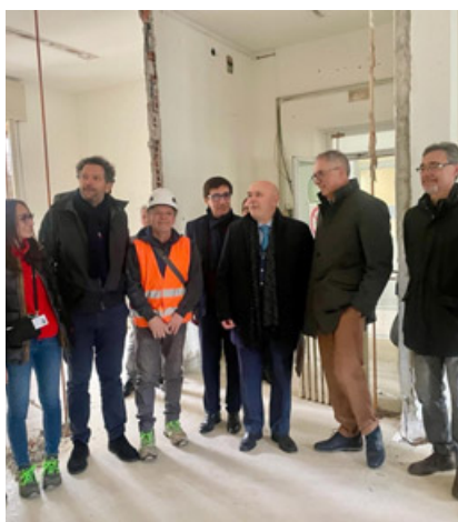
La visita al cantiere delle autorità

«Grazie a un investimento regionale pari a oltre 4 milioni di euro – ha precisato il sindaco Zucca – verrà creata una nuova struttura medicale di prossimità, al servizio di non meno di 50.000 residenti nell'area del Pavese e del Basso Pavese». La ristrutturazione di un corpo inutilizzato sito nel cortile centrale, permetterà infatti la nascita della Casa di Comunità di Belgioioso. «Conterrà un ospedale di comunità con 20 posti letto, un poliambulatorio modernamente attrezzato per visite specialistiche che sarà gestito da Asst – ha confermato Frignani – per offrire un servizio al paziente nella sua globalità». Nel frattempo, saranno avviati importanti lavori di riqualificazione dei reparti ospedalieri, rivolti a est. Anche il presidio del San Matteo di Belgioioso, come la grande sede del Policlinico di Pavia, è nato infatti con una architettura a padiglioni, progettata negli anni Cinquanta secondo la visione di Camillo Golgi, che fu Premio Nobel per la Medicina. «Oggi – ha spie-