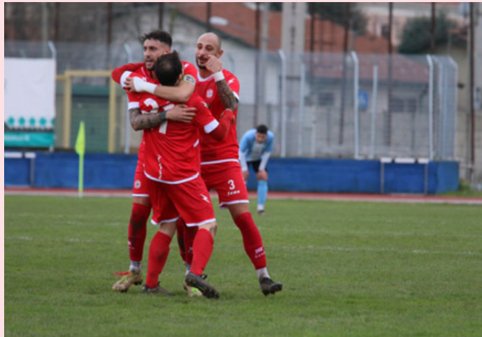
I giocatori dell'Oltrepò festeggiano il gol vittoria