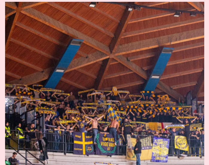
I tifosi del Vigevano non fanno mai mancare il loro supporto