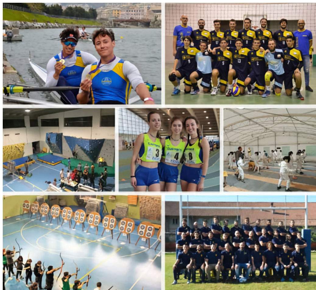
Il Cus Pavia ha oltre 2.800 iscritti in molte discipline sportive

richieste. Il Cus Pavia è affiliato al Cusi (Centro universitario sportivo italiano). Una realtà complessa con ben sette sezioni agonistiche (atletica leggera, canoa, canottaggio, pallavolo, rugby, scherma, e tiro con l'arco). Sono iscritti al Cus più di 2.800 tesserati. Quanti campioni si sono laureati e sono passati dal Cus Pavia? Tanti, uno su tutti? Andrea Re, ex canottiere italiano, 8 volte campione mondiale nei pesi leggeri di canottaggio, tra il 1985 e il 1995. Inoltre, anche in collaborazione con il Corso di Laurea in Scienze Motorie Preventive e Adattate dell'Università di Pavia, da alcuni anni organizza l'Attività sportiva adattata (A.s.S.) rivolte ai soggetti disabili. Educazione in quanto, come da etimologia, uno degli scopi di questa attività è quello di “tirar fuori” da ogni individuo, attraverso il movimento e il gioco, quelle risorse e caratteristiche personali che lo porteranno a raggiungere il massimo dell'autonomia possibile. Motoria in quanto il movimento è inteso anche come opportunità sociale offerta a dei soggetti in diverse condizioni di età, capacità intellettuale, fisica e relazionale.