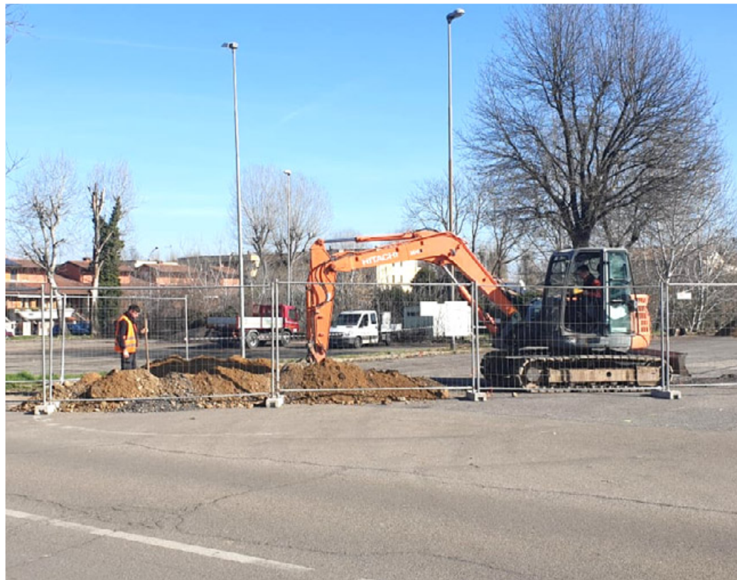
Al via i lavori di Pavia Acque in Piazza Volontari del Sangue

tino. Con questo in oggetto, completiamo i lavori di riqualifica green: insieme ad asilo nido, scuola elementare, scuola media, avremo anche la scuola d'infanzia. Un complesso di ambienti completa-