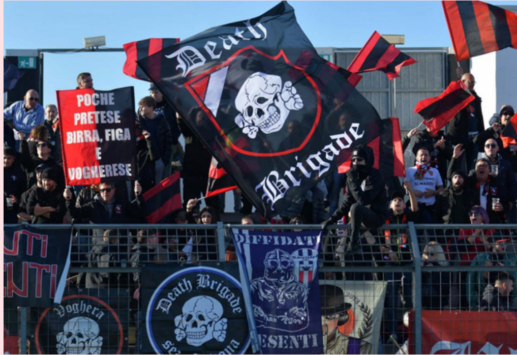
I tifosi della Vogherese sono chiamati a supportare la loro squadra

«In questa stagione il nostro obiettivo, lo sapevamo sin dall'inizio, è la salvezza e faremo