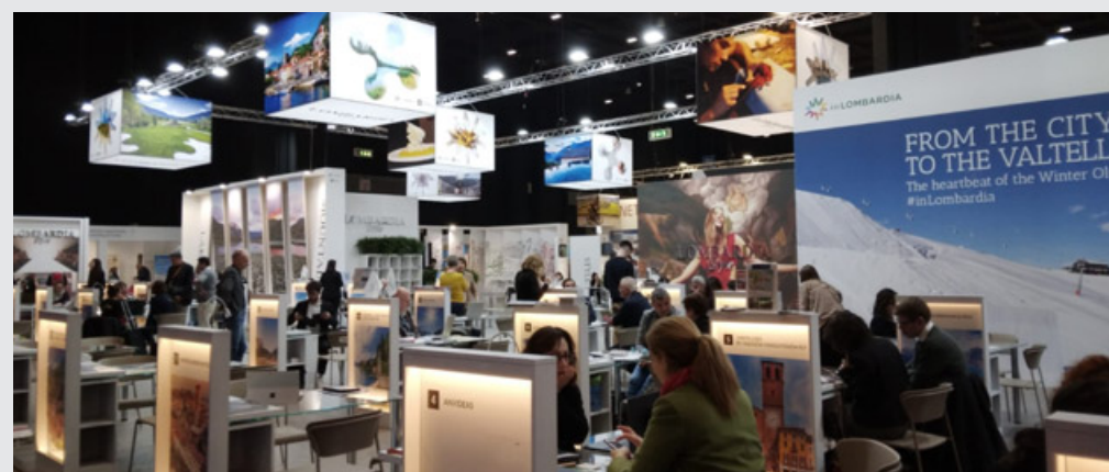
Lo stand della Lombardia alla Bit