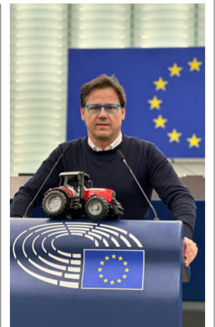
L'eurodeputato Angelo Ciocca a Strasburgo

Le principali sfide che l'Italia deve affrontare all'interno dell'Unione Europea sono legate alla crisi economica, alla disoccupazione, all'immigrazione e alla gestione dei flussi migratori cui serve porre un freno deciso una volta per tutte. Il problema è innanzitutto comunitario e questo serve che anche a Bruxelles lo capiscano. E' importante lavorare per migliorare la compe-