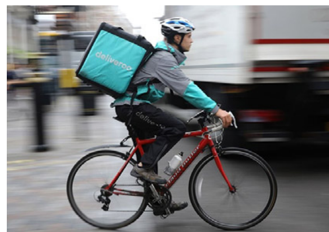
Deliveroo amplia i suoi servizi di consegna a domicilio a nuovi paesi in Oltrepò Pavese

I clienti, attraverso il web o le app sugli smartphone, possono cercare un ristorante associato e concordare la consegna o il servizio d'asporto presso il locale del cibo scelto. Al momento di pagare è possibile “arrotondare” il conto in eccesso e donare alla Croce Rossa Italiana la differenza che sarà usata per fornire beni di prima necessità e cibo a persone e famiglie in difficoltà. R.P.