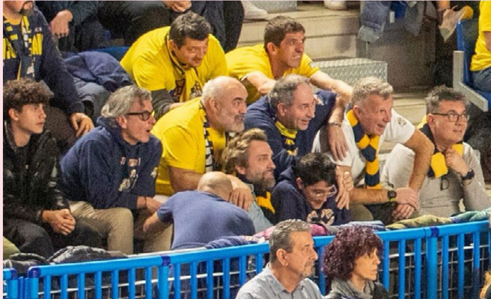
I Papy Gialloblù al PalaElechem