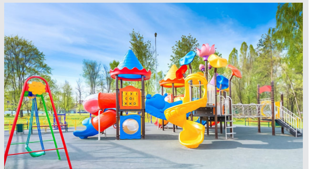
Saranno sei i nuovi parchi gioco inclusivi in provincia di Pavia

«Regione Lombardia – ha sottolineato l'assessore – vuole favorire l'inclusione. Vogliamo migliorare la qualità di vita e il benessere psicofisico delle persone con disabilità, offrendo percorsi di attività ludiche e percorsi naturalistici accessibili. I Parchi Inclusivi sono parte di questo obiettivo. Migliorano i processi di socializzazione e di integrazione delle persone con disabilità motorie. Quindi, migliorano la socializzazione di tutta la nostra comunità». R.P.