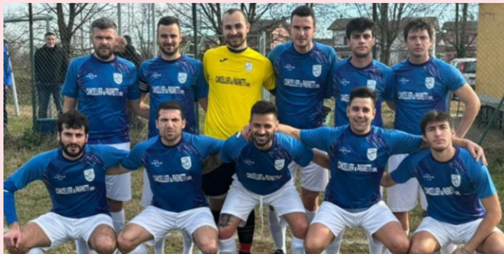
Borgo San Siro