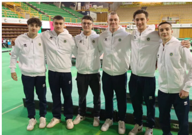
La squadra che prenderà parte al campionato A2 maschile di ginnastica per la Costanza

KICKBOXING – Buona prestazione degli atleti della Palestra Malibu