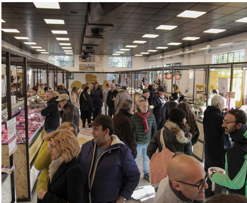
L'interno del Mercato Coperto di Campagna Amica

È nato a ottobre 2023 e si è posto fin dai primi momenti l'obiettivo di mettere in risalto i prodotti agroalimentari del territorio pavese. Si tratta del nuovo mercato coperto di Campagna Amica situato in viale Golgi, proprio dietro la stazione ferroviaria, in uno stabile appositamente ristrutturato. Siccome mira a essere un punto di riferimento non solo per gli abitanti di Pavia, ma anche per coloro che provengono dal territorio, nei pressi del mercato si può trovare un comodissimo parcheggio. Trecento metri quadrati che ospitano prodotti del pavese. Quelli agricoli non mancano, ma non sono gli unici. Solo per fare alcuni esempi, al mercato si possono trovare vino, riso e insaccati. La provincia di Pavia, in fatto di buona cucina, non ha nulla da invidiare a nessuno. A Pavia si va per assaggiare il ragò, interpretazione locale della cassoulet, i munighili, le golose polpette di carne, e poi l'ossobuco con piselli e il bollito con salsa verde. E poi non mancano nemmeno i dolci, con la pro-