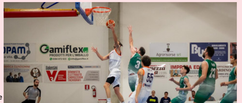
Robbio in azione