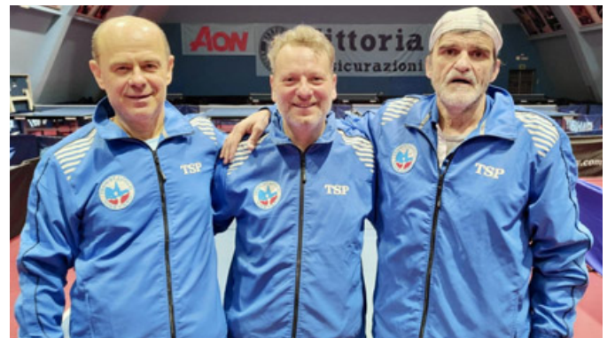
La squadra di serie A1 Master di tennistavolo

Scotta. Successivamente la compagine Lomellina ha superato l'Olimpia con un convincente 3 a 1. Dopodiché è arrivata la sconfitta con il forte Milano. Questo primo concentramento del girone A che comprende anche i campioni d'Italia del Milano Sport si è svolto nel bellissimo centro sportivo Bonacossa di via Mecenate nella metropoli lombarda. Il campionato dopo una pausa di un mese e mezzo riprenderà il 3 marzo con il concentramento di Verzuolo dove la società vigevanese