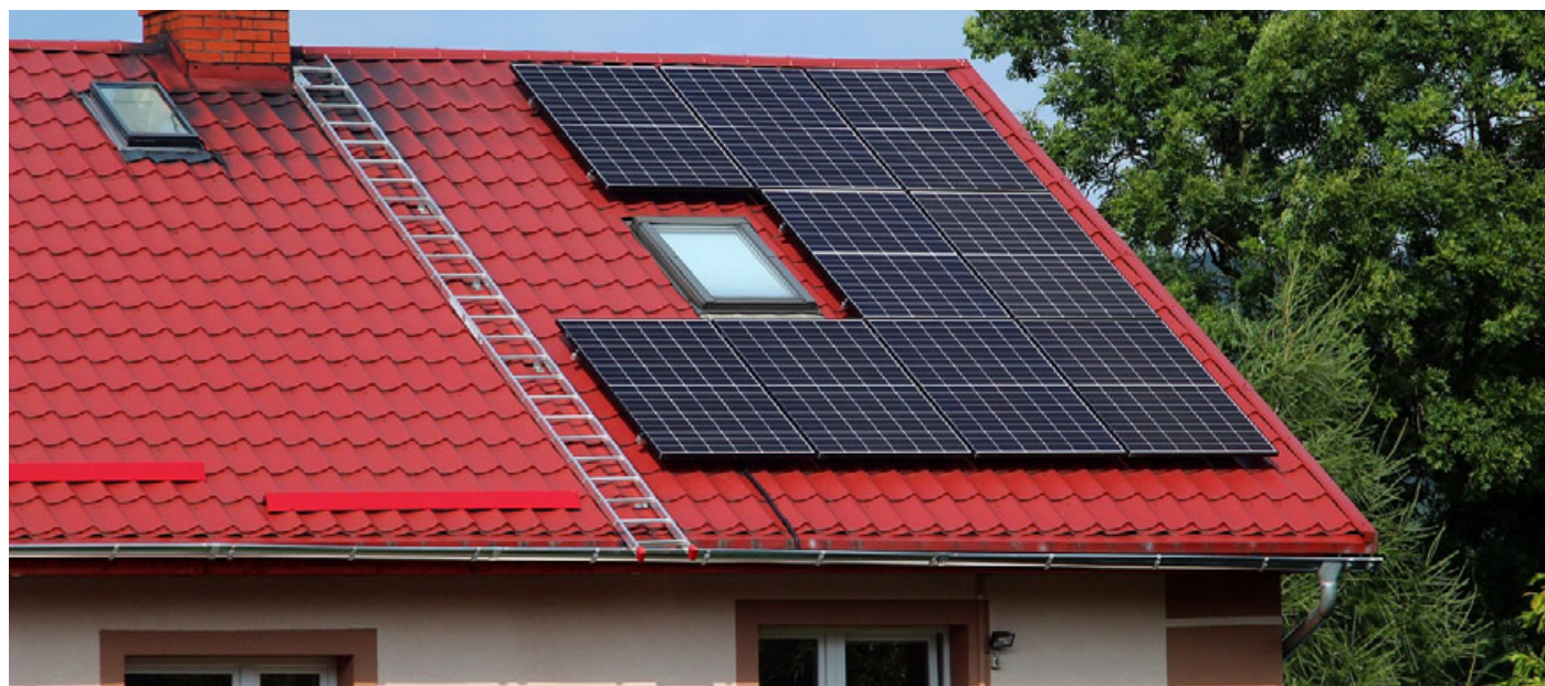
Le Cer nascono con l'idea di creare delle isole autosufficienti dal punto di vista energetico

Via al progetto “Parliamo di Cer”, due giornate di workshop per il progetto C.e.r. Chiamo Energia, che tocca e approfondisce il tema delle Comunità Energetiche in un tour informativo che tocca ben sette comuni del Gal Risorsa Lomellina. Il progetto diventa occasione di approfondimento con azioni locali che hanno previsto per Gal Risorsa Lomellina due giorni di tour, il 6 e il 7 febbraio. Un serrato giro di appuntamenti in ben sette Comuni, che si sono dimostrati interessati a portare avanti il progetto iniziale, lanciato a luglio dello scorso anno, che ha visto un importante convegno il 15 dicembre in Regione Lombardia, patrocinato dalla Commissione Europea. I comuni interessati sono Mede, Cilavegna, Nicorvo, Valle Lomellina, Breme, Suardi, Torre Beretti e Castellaro. «Siamo molto ottimisti – ha detto il presidente del Gal Risorsa Lomellina Stefano Leva – sullo sviluppo concreto di questo progetto, il progetto Cer è rilevante in quanto può avere ricadute a livello sociale, economico, ambientale e può essere uno strumento per il con-