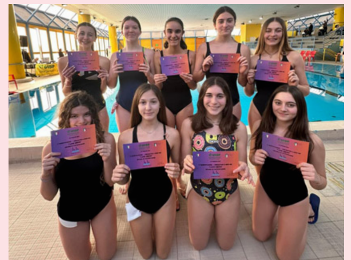
Le giovani atlete del team di nuoto artistico