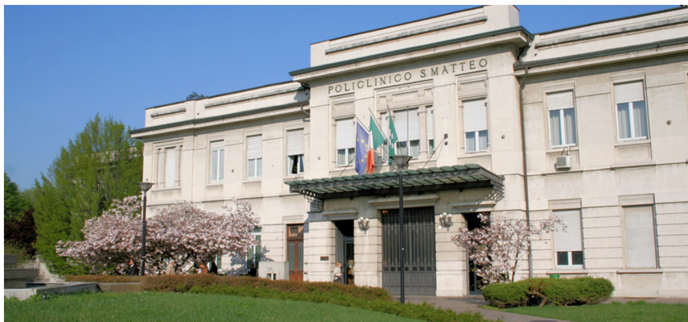
L’ingresso storico del Policlinico San Matteo

Quando è stato costruito, nel lontano 1449, era stato nominato “Ospedale della Pietà”, per sottolineare che la “pietas”, cioè l’amore verso il prossimo, doveva essere il principio ispiratore dell’attività svolta al suo interno. Le tre figure della Pietà - il Cristo morto sorretto dalla Vergine e da San Giovanni - del rilievo attribuito ad Antonio Mantegazza sono il simbolo dell’ospedale. L’epigrafe sottostante può considerarsi il manifesto programmatico dell’attività svolta dal San Matteo: “Questa città un tempo capitale di regno, città generosa, famosa per i suoi uomini, eccelsa casa per i poveri, porta a compimento quest’opera di pietà: qui il malato, grazie alle cure prestate dal medico, ritrova la salute, qui l’indifeso vive al sicuro, qui domina una sola fede”. Posto in origine sul fronte meridionale dell’ospedale, il rilievo è oggi sostituito da una copia essendo l’originale ai Musei Civici di Pavia. Il San Matteo, il policlinico di Pavia, è diventato con il tempo un vero e proprio punto di riferimento per la sanità del territorio pavese. La vicinanza