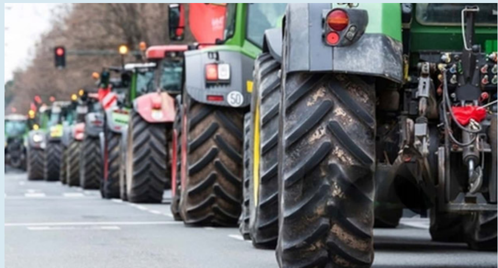
I trattori della protesta arrivano a Mortara

seguente licenziamento di un gran numero di lavoratori. Gli agricoltori italiani, oltre a condividere le istanze dei colleghi europei, chiedono una maggiore protezione del Made in Italy e lotta senza quartiere alle speculazioni. Previsti eventuali cambi di viabilità per consentire lo svolgersi del corteo, che verranno opportunamente comunicati nel corso di questi giorni che antecedono la manifestazione. Il presidio continuerà ad oltranza ed è prevista la partecipazione dei cittadini e delle istituzioni locali a fianco degli agricoltori lomellini e dei colleghi di altri distretti vicini. E.V.