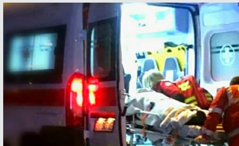
Dopo la rissa portati entrambi in codice rosso al San Matteo