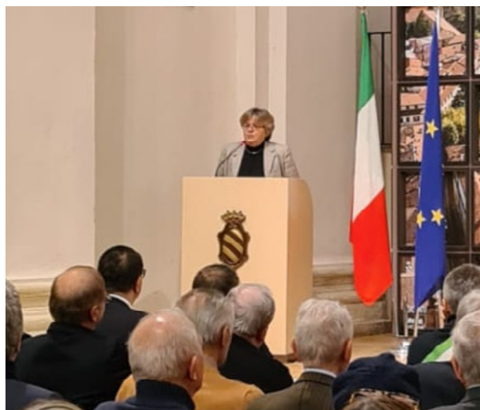
L'intervento del prefetto Francesca De Carlini, l'aula magna del Ghisleri gremita

C'è una storia che è stata per tanto tempo dimenticata: si tratta del dramma delle Foibe. Queste grandi, profonde spaccature del terreno, tipiche delle montagne del Carso, sono diventate tristemente famose per i massacri e gli eccidi perpetrati nei confronti di italiani da parte delle milizie della Jugoslavia di Tito verso la fine della Seconda guerra mondiale. Questi massacri iniziarono dopo l'8 marzo 1943 con lo sfaldamento delle forze armate italiane seguite al crollo del regime fascista, quando nei territori dell'Istria il potere venne assunto dal movimento di liberazione jugoslavo. Le vittime non furono solo gerarchi fascisti, o esponenti politici e istituzionali, ma anche semplici personaggi in vista della comunità italiana, considerati un ostacolo per l'affermazione del nuovo corso politico. Per ricordare questa triste pagina, il 10 febbraio è diventato il Giorno del Ricordo, una solennità civile nazionale italiana, istituita con la legge del 30 marzo 2004, una giornata che vuole "conservare e rinnovare