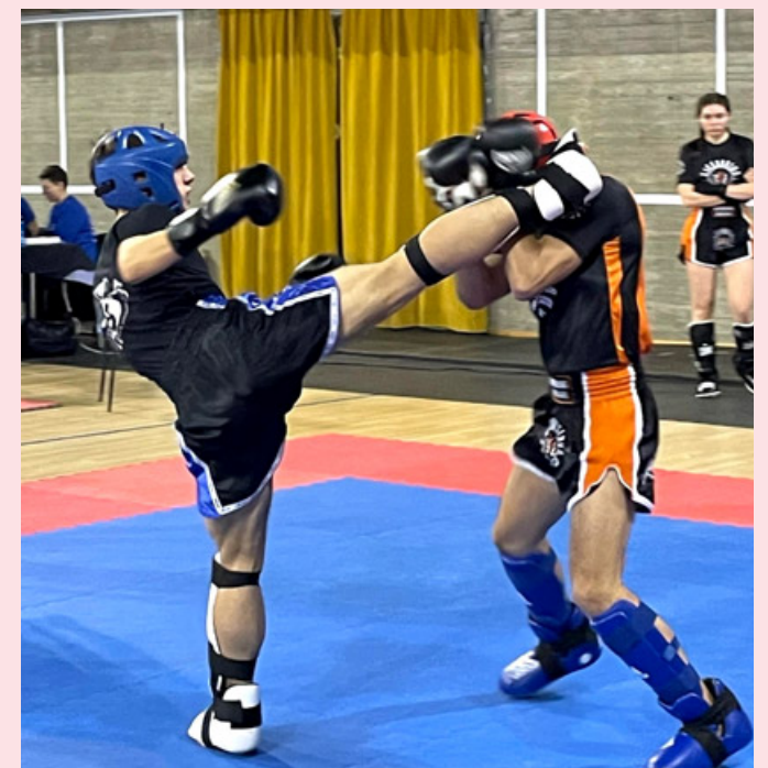
Incontro di kickboxing