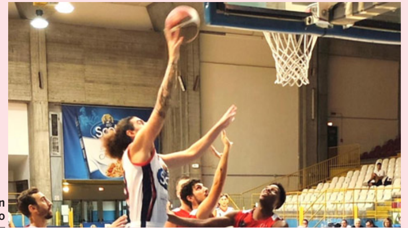
La Riso Scotti in azione sotto canestro