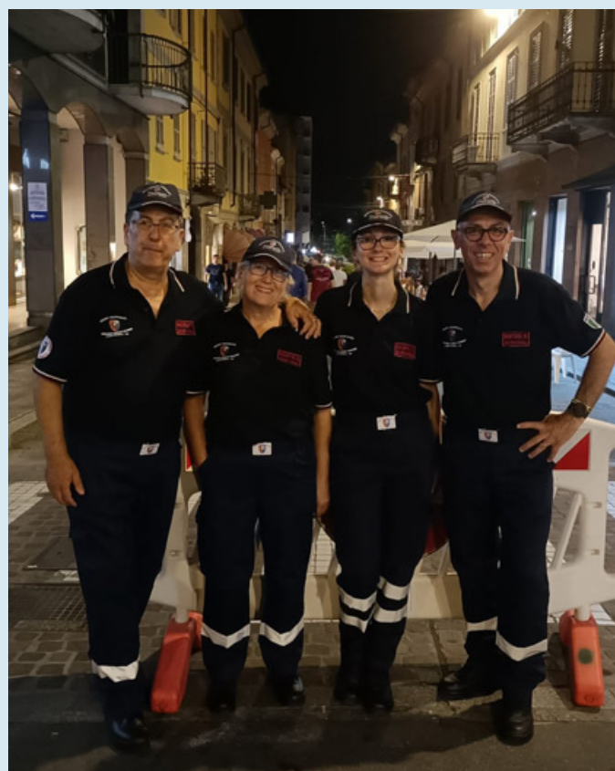
Un gruppo di volontari dell'Anc

LAVORO – Nuovi paesi saranno serviti dal servizio di consegna a domicilio