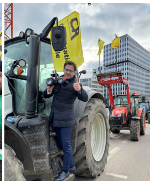
Alcuni momenti mentre l'eurodeputato Ciocca spiega agli agricoltori in protesta quello che farà con il modellino