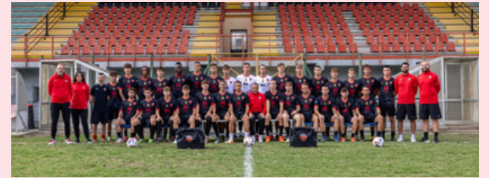
La rosa della Vogherese

PROSSIMO TURNO - Albenga - Città Di Varese, Alcione - Sanremese, Asti - Fezzanese, Borgosesia - Alba, Bra - Pont Donnaz, Gozzano - Chisola, Lavagnese - Pinerolo, Ticino - Chieri, Vado - Ligorna, Vogherese - Derthona