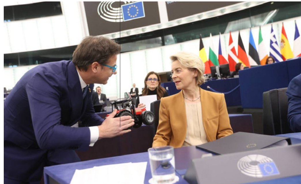
La consegna del trattore giocattolo a Ursula Von Der Leyen

Il mio gesto è stato un atto di protesta contro le politiche folli dell'Unione Europea che, a mio avviso, danneggiano l'agricoltura italiana e l'economia del nostro Paese. Il trattore giocattolo rappresenta un settore agroalimentare che è fondamentale per l'Italia e l'Europa intera e la bandiera italiana simboleggia il nostro orgoglio nazionale. Non siamo disposti a farci calpestare da queste politiche folli, ideologiche e strumentali verso gli interessi delle grandi lobby e multinazionali. L'avevo già fatto in passato con la scarpa nei confronti del commissario all'economia Moscovici. Ora il messaggio è stato recapitato direttamente alla Presidente della Commissione europea. Proprio nei giorni precedenti mi ero unito alle proteste degli agricoltori scesi in presidio a Bruxelles e Melegnano ed in dono avevo ricevuto quel trattore giocattolo, simbolo di pace verso una Commissione che deve fare retromarcia su molte direttive dannose per i tanti lavoratori, cittadini ed imprese.