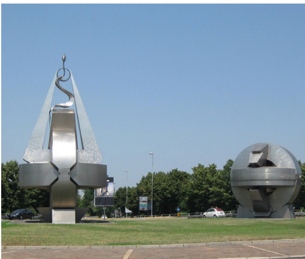
L'opera di Carlo Mo dedicata ad Alboino e Teodolinda

tori pavesi "i Fedegari" e rappresentano, secondo l'identificazione più tradizionale e accertata, Alboino e Teodolinda, due tra i sovrani longobardi più noti e celebrati. Il gusto popolare è tuttora fortemente combattuto per l'accettazione - o meno - di tale monumento alla storia dell'antica capitale italiana. Tra chi pensa che queste sculture si trovino in una zona troppo percorsa dal traffico, per indurre a un'attenta riflessione su un passato distante più di 14 secoli dal nostro tempo, a chi le ritenga troppo moderne e futuristiche dal punto di vista artistico e quindi anacronistiche rispetto alla Pavia longobarda. D'altra parte, c'è chi ne riconosce il valore, l'essenza primaria, pur ammettendo che la propria ubicazione non ne valorizzi sufficientemente l'importanza. Facili da vedere questo sì, ma in virtù della posizione in un grande nodo trafficato, impossibili da vedere da vicino. Chi era Alboino? Fu colui che condusse 150mila Longobardi, tra soldati e civili, in una grande migrazione in Italia, per trovare una nuova patria per il suo popolo. Secondo quanto raccontato da Paolo Diacono (unica fonte a nostra disposizione) fu