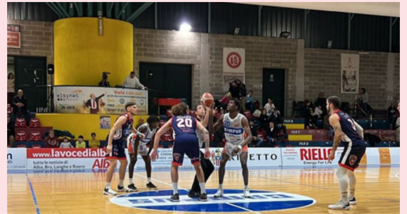
Ottima prova per la Riso Scotti