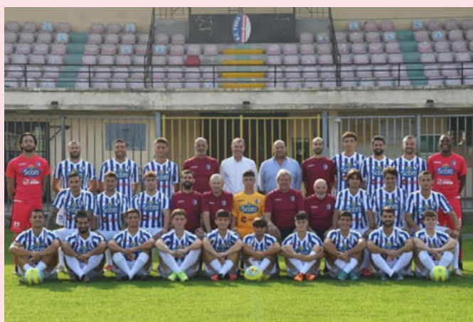
La rosa del Pavia