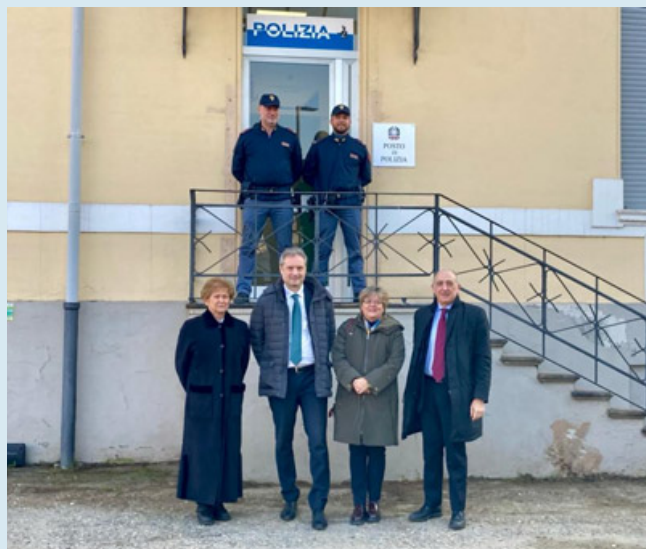
Un momento della visita al presidio di Polizia

Era stato annunciato e promesso, ora è a tutti gli effetti operativo il Posto di Polizia all'Ospedale civile di Vigevano. Un percorso che era stato avviato dal prefetto di Pavia Francesca De Carlini e dal questore Nicola Falvella, in applicazione di un preciso indirizzo del Ministro dell'Interno, volto all'innalzamento della sicurezza negli ospedali del territorio. Il Posto di Polizia, situato in un'area attigua al Pronto Soccorso, è funzionante dalle 8.00 alle 20.00. A questo si aggiunge, dalle ore 20.00 alle 8.00, un servizio di vigilanza privata e ulteriori misure di sicurezza integrata quali linee punto a punto tra nosocomio e Forze di Polizia, coordinate in sede di Comitato Provinciale per l'Ordine e la Sicurezza Pubblica. Il nuovo Presidio è stato visitato lo scorso 25 gennaio dal prefetto e dal questore, presente anche il direttore generale dell'Asst, Andrea Frignani, in occasione della seduta del Comitato Provinciale per l'Ordine e la Sicurezza Pubblica itinerante che il prefetto De Carlini ha presieduto a Vigevano e che vedrà prossimamente il Comitato convocato a Stradella il 31 gennaio prossimo. La seduta del Comitato Provinciale per