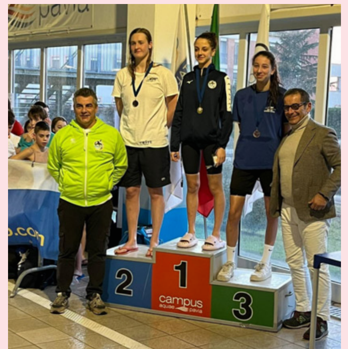
Podio al Trofeo natatorio organizzato da Campus Aquae

Enorme successo a Pavia dove si è conclusa la quarta tappa del Trofeo natatorio Barosselli&Ferrari. Nelle vasche del centro sportivo Campus Aquae di Strada Cascinazza 29 nella giornata di domenica 21 gennaio è andata in scena una bella e sana competizione di nuoto organizzata dalla squadra di casa, Campus Team. All'evento hanno partecipato atleti in età comprese tra gli otto e i 25 anni, per un totale di circa 300 iscritti provenienti da diverse Società lombarde. Gli atleti di casa hanno dato ottima prova di sé nonostante il grande carico dell'ultimo periodo di allenamenti che hanno aperto un ultimo ciclo di gare prima delle manifestazioni obiettivo (Coppa Lombardia per i nuotatori più giovani, Campionati Regionali, Campionati Italiani assoluti e di categoria). Importanti risultati e personal best hanno incluso anche alcuni pass per i Cam-