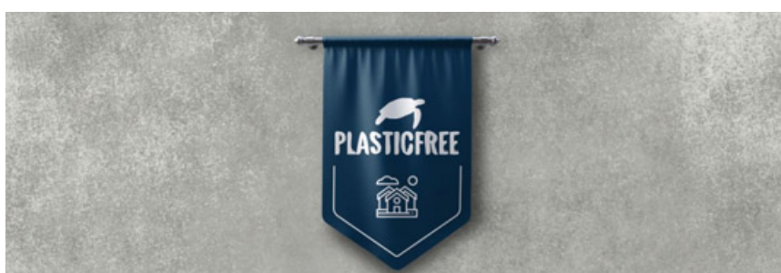
Il gagliardetto che sarà dato a tutti i comuni Plastic Free

AMBIENTE – Scoperta una discarica abusiva tra Mortara e Gambolò