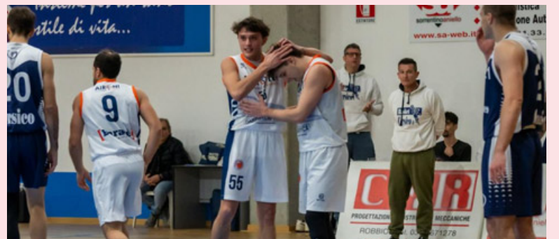
Per Robbio una brutta sconfitta