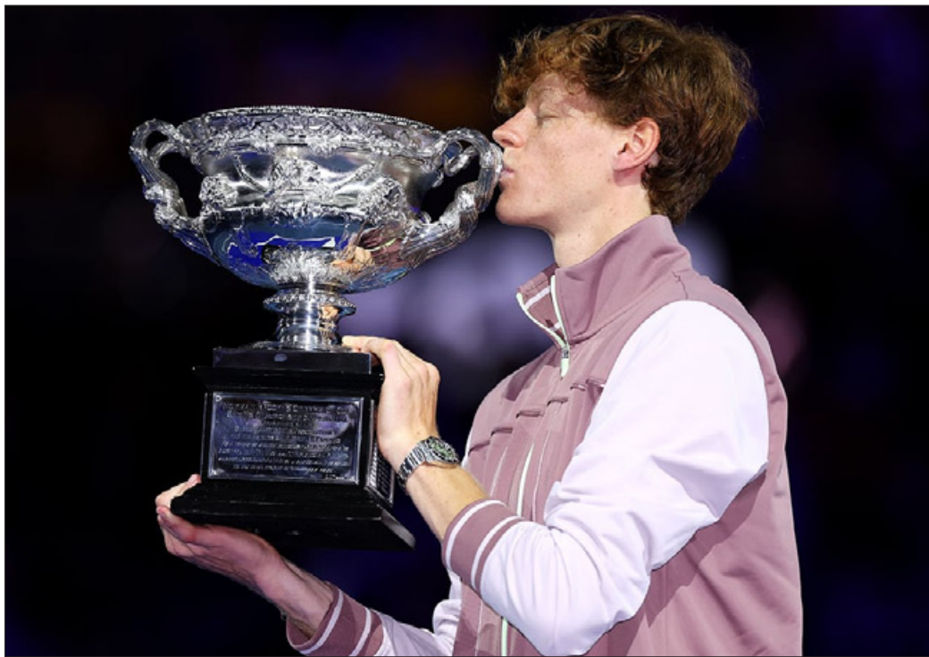
Jannik Sinner bacia la coppa dopo la sua vittoria negli Australian Open

Ma le parole più attese erano quelle di Jannik; parole che chissà quante volte avrà pensato negli scorsi giorni: «È una vittoria importantissima in un grande torneo per me – ha esordito Sinner – voglio ringraziare tutti quelli che hanno reso questo Slam così speciale. Daniil mi congratulo con te, hai disputato un torneo eccezionale. Abbiamo giocato diverse finali ma in ogni incontro dimostri qualcosa per cui dovrò migliorare. Hai fatto uno sforzo eccezionale in questo torneo. Ti auguro