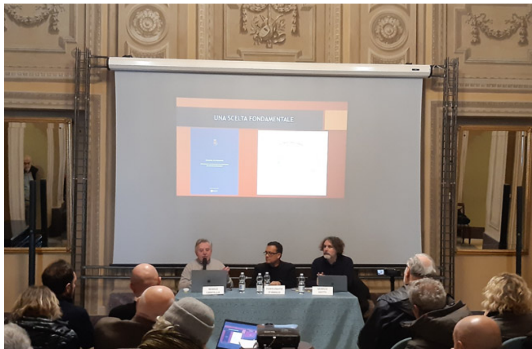
Un momento del convegno sul futuro del Castello Visconteo

SICUREZZA – Operativo tutti i giorni dalla 8 alle 20. In città aumenteranno le pattuglie