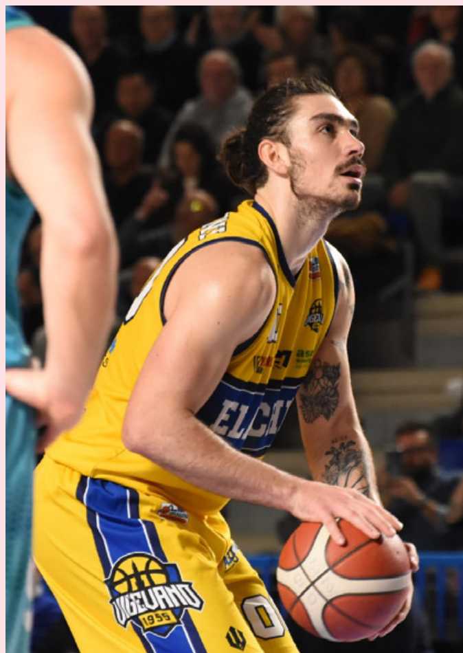
Azione tra Vigevano e Rieti