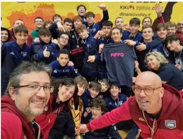
Gli atleti e gli allenatori del Gifra festeggiano la vittoria