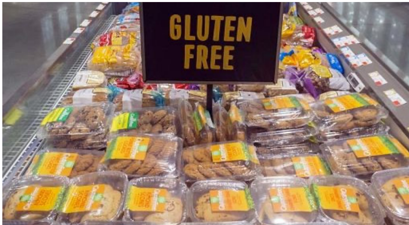
I celiaci non devono assolutamente mangiare prodotti contenente glutine

«Le malattie dell'apparato digerente rappresentano la terza causa per ricovero ordinario in Italia e la stesura di queste Linee Guida vuole essere uno strumento da fornire ai medici per migliorare la diagnosi e la cura dei pazienti,