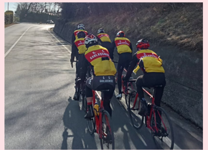
Un allenamento della Garlaschese