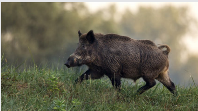
Gli interventi di biosicurezza servono per evitare contatti tra i cinghiali e i suini negli allevamenti

ISCRIZIONI POSSIBILI FINO AL 15 MARZO 2024