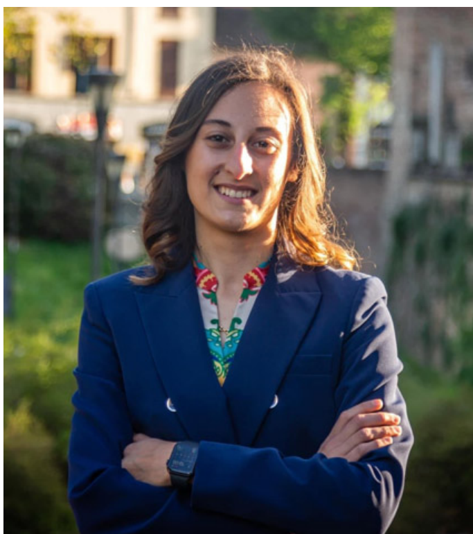
Il sindaco Alice Zelaschi

La volontà è di installare un ascensore per abbattere le barriere architettoniche e di creare nuovi servizi igienici e nuovi pavimenti. Gli alloggiamenti del primo piano saranno ampliati e riqualificati, mentre il secondo piano, attualmente inutilizzato, sarà destinato ad abitazione per il comandante della Stazione. È previsto anche l'adeguamento