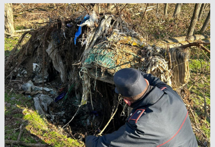
La discarica abusiva di amianto è affiorata dopo le piogge di agosto