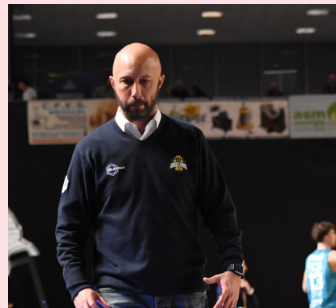
L'allenatore Panza avrà il suo da fare