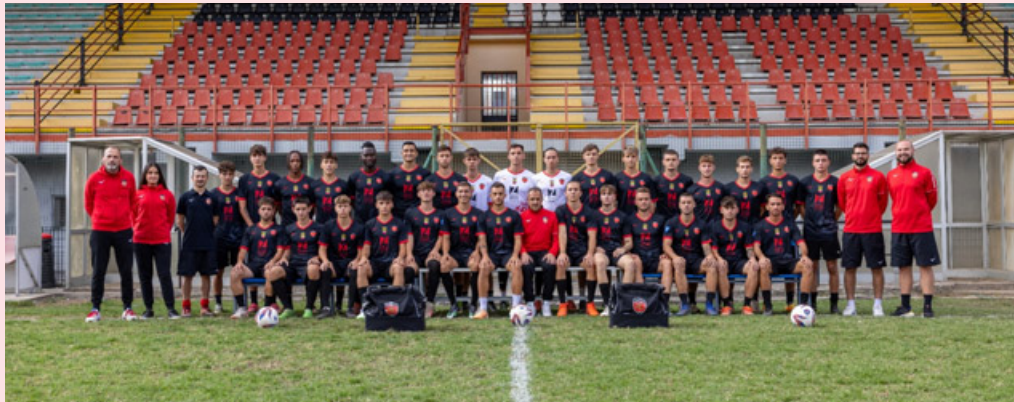
La rosa della vogherese al completo