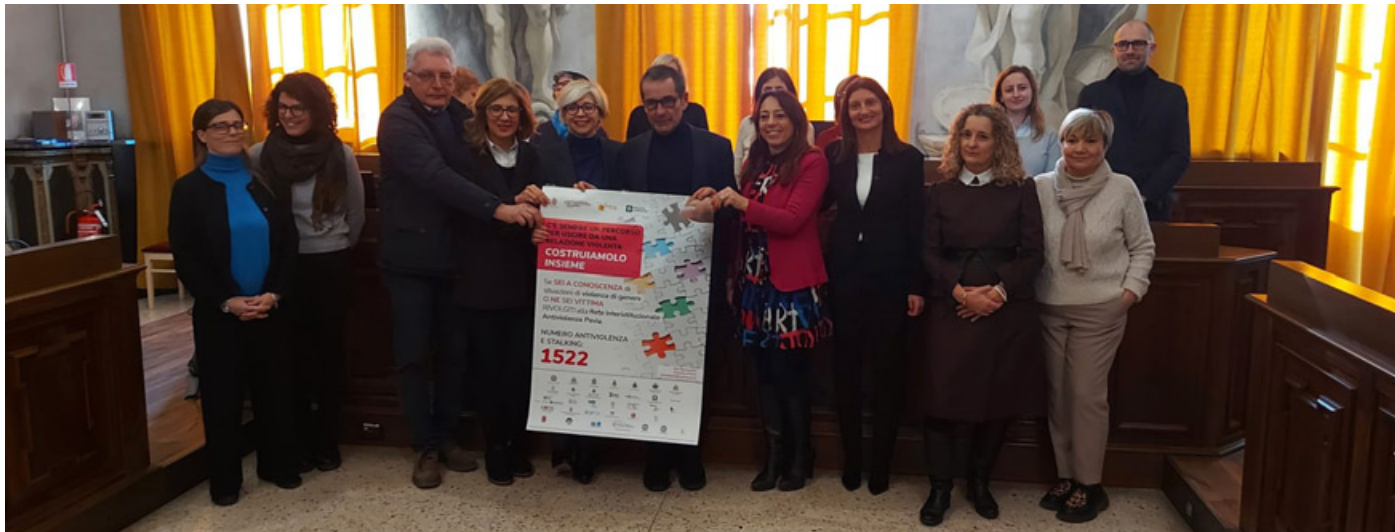
Foto di gruppo alla presentazione della nuova campagna informativa

Punta inoltre a diffondere su tutto il territorio provinciale i recapiti di accesso ai servizi erogati dalla Rete, a partire dai centri antiviolenza, e a sensibilizzare e responsabilizzare tutti i cittadini e le cittadine affinché intervengano nel caso intercettino situazioni di violenza di genere. La nuova campagna sceglie come icona il puzzle per raffigurare il percorso per la fuoriuscita dalla violenza, lad-