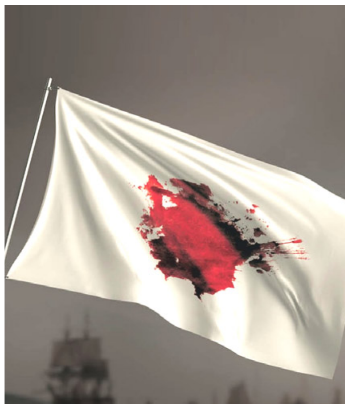
Particolare del manifesto dello spettacolo

Appuntamenti d’opera che sono stati inaugurati lo scorso settembre dalla rassegna “Preludi d’autunno. Intersezioni sinfoniche” in cui i cinque appuntamenti con “Sturm und drang”, “Sherazade”, Regine tragiche e i Carmina Burana, hanno aperto la strada al flauto magico di Mozart, al Don Carlo e al Luisa Miller di Verdi, all’incoronazione di Poppea di Monteverdi. La pièce teatrale con protagonista Cio-cio-San e Pinkerton fu vista nel 1900 a Londra Giacomo Puccini nella versione David Belasco. Colta la portata di quanto messo in scena nella capitale inglese, Puccini decise di realizzarne la musica. Giuseppe Giacosa e Luigi Illica, già