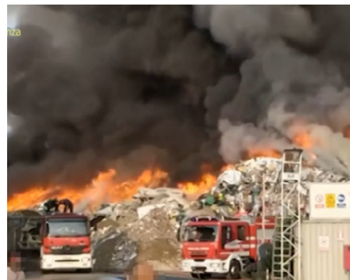
Il rogo alla Berté avvenuto sette anni fa