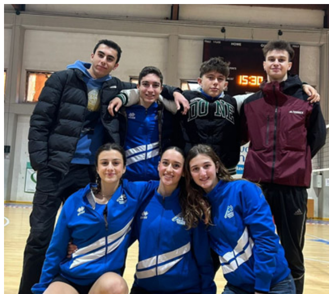
Gli atleti che hanno preso parte alla riunione a Saronno

NUOTO – Grande partecipazione alla 4ª tappa del Barosselli&Ferrari