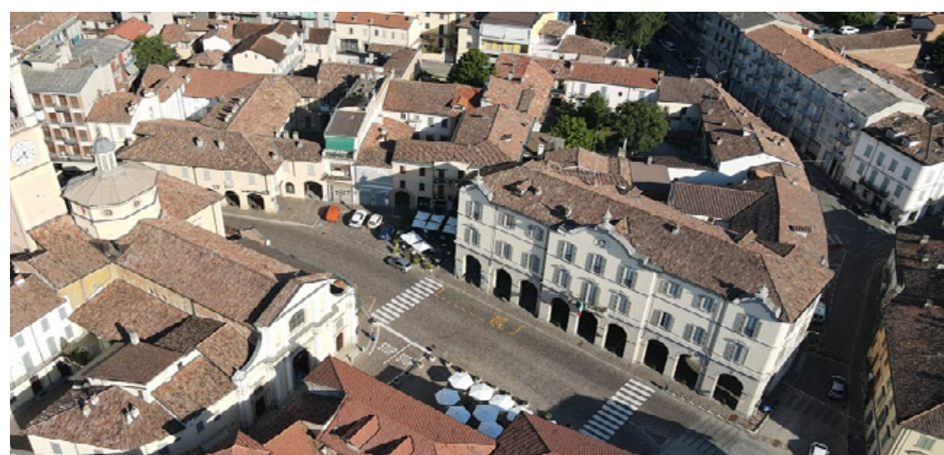
Il Comune di Broni ha emesso il bando per i caregiver