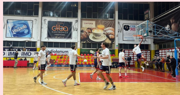
La Riso Scotti durante il riscaldamento prima della partita con il Saronno