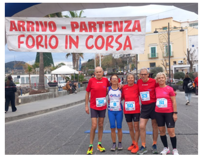
I protagonisti della gara a Forio

hanno potuto ammirare le bellezze di questa località tra le più belle al mondo sempre assiepati di turisti. R.S.