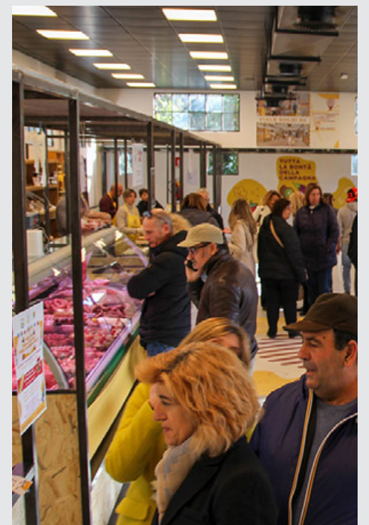
Il Mercato Coperto di Pavia

I clienti del Mercato Coperto di Campagna Amica Pavia potranno gustare queste speciali agricolazioni e agriaperitivi direttamente sul posto e negli orari di apertura del Mercato, e cioè il venerdì pomeriggio (dalle 15.30 alle 20) e il sabato mattina (dalle 8.00 alle 13.30). L'iniziativa prenderà il via dal pomeriggio di venerdì 19 gennaio con l'agriturismo N'Uovo di Casolnovo, che sarà in viale Golgi 84 anche durante la mattina di sabato 20 gennaio. In seguito saranno presenti al Mercato Coperto gli agriturismi Cascina Serzego di Val Di Nizza, Cella di Montalto di Montalto Pavese, Casa Casoni di Canneto Pavese, Tenuta Borgolano di Montescano e Oranami di Ponte Nizza. «Questi eventi sono un ulteriore modo per essere