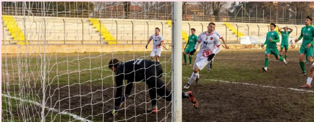
Minaj ancora in gol