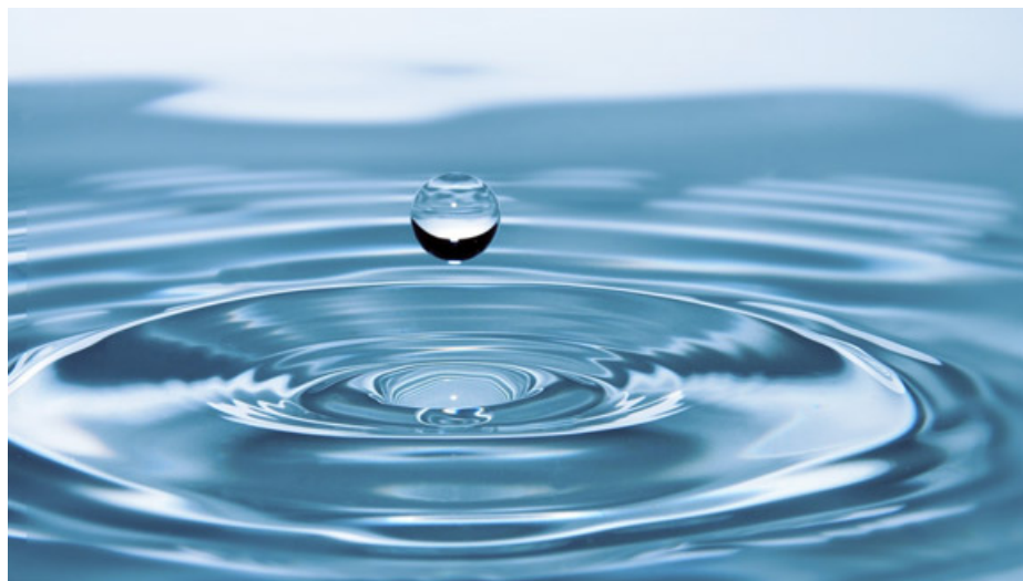
Bonus Idrico Provinciale a oltre 4.700 famiglie pavese