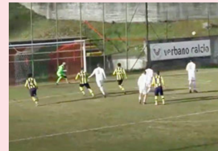
Il momento del pareggio del Casteggio