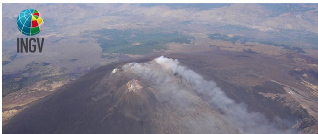
La cima dell'Etna in una veduta aerea

CAMPAGNA AMICA – Al via un nuovo servizio di ristorazione con il meglio della provincia