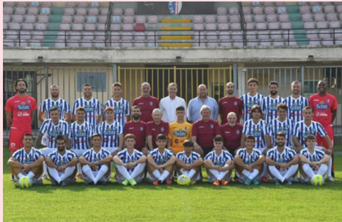
La rosa del Pavia