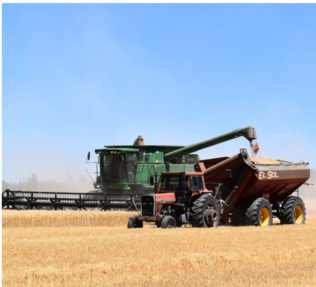
L'agricoltura in Italia ha avuto nel clima il peggior nemico

ucraino. Tuttavia, l'andamento è stato fortemente influenzato dai fattori climatici avversi che hanno caratterizzato gran parte dell'anno, compromettendo i risultati di molte colture. I prezzi, ancora in crescita, hanno registrato una variazione più moderata rispetto al 2022. L'aumento dei prezzi dei prodotti venduti (+4,2 per cento) nel 2023 è stato più pronunciato rispetto a quello dei beni acquistati (+2,3 per cento), invertendo la tendenza riscontrata nel biennio 2021-2022, quando i rincari delle materie prime agricole e dei prodotti energetici avevano pesantemente influito sui costi di produzione. Il valore corrente della produzione totale del settore agricolo è aumentato del 2,7 per cento (73,5 miliardi di euro a fronte dei 71,5 del 2022), in presenza di un calo dell'1,4 per cento dei volumi di beni prodotti accompagnato da una crescita del 4,2 per cento dei relativi prezzi di vendita. Nel 2023 si è riscontrata una modesta riduzione delle quantità dei prodotti impiegati (-0,6 per cento) a cui è corrisposto un aumento dell'1,6 per cento della spesa per consumi intermedi (35,3 miliardi di euro contro 34,7 miliardi del 2022), in presenza di un incremento del 2,3 per cento dei prezzi dei beni acquistati. Di conseguenza, il valore aggiunto ai prezzi base è cresciuto in valore del 3,8 per cento (38,2 miliardi di euro contro 36,8 del 2022) mentre si è ridotto in volume del 2 per cento.