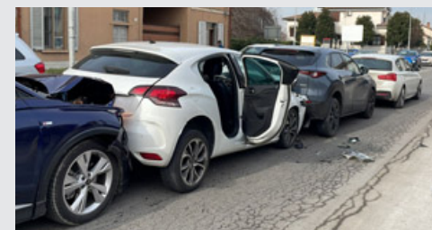
Il maxi-tamponamento che ha coinvolto il Retorbido