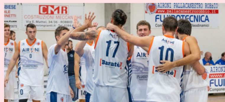
Aironi Robbio festeggia la vittoria nel derby con la Sanmaurense