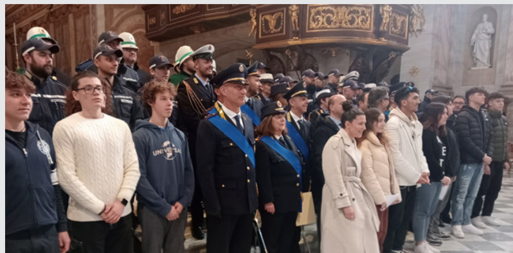
Foto con la polizia locale nel Duomo di Vigevano