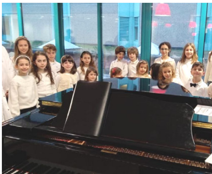
Il coro delle voci bianche