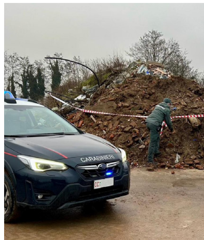
Carabinieri mentre posizionano i sigilli

Abbandono di rifiuti che è stato rinvenuto anche presso lo spazio dell'azienda Building e Construction di Lomello, dove durante un'operazione portata a termine mercoledì 13 dicembre 2023, le forze dell'ordine, tra cui il nucleo Carabinieri Forestale