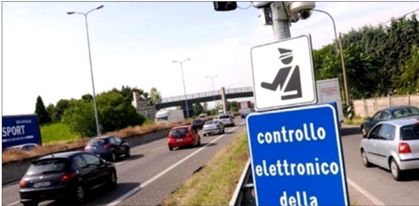
L'Italia è il Paese europeo con più autovelox

A lzi la mano chi non è stato multato da un autovelox? Strumento spesso usato dai comuni per fare cassa, più che per prevenire l'eccessiva velocità. Strumento che piace così tanto che l'Italia conta il maggior numero di autovelox installati lungo le strade, con le ultime stime che registrano 11.130 mila apparecchi di rilevazione automatica della velocità lungo tutta la penisola, più di Gran Bretagna (circa 7.700), Germania (oltre 4.700), Francia (3.780). Lo afferma il Codacons, che interviene sui sempre più frequenti casi di autovelox smantellati ad opera di ignoti, fenomeno che sta interessando diverse zone d'Italia, dalla Lombardia al Veneto, dal Piemonte all'Emilia Romagna. E un nuovo abbattimento si registra per un impianto autovelox in Veneto nelle scorse notti. Il misterioso "Fleximan" ha colpito in provincia di Padova. In base ai dati ufficiali del ministero dell'Interno, nel 2022 le principali 20 città italiane hanno incassato un totale di 75.891.968