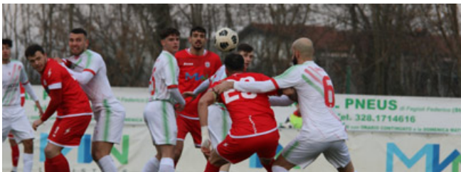
Azione di gioco