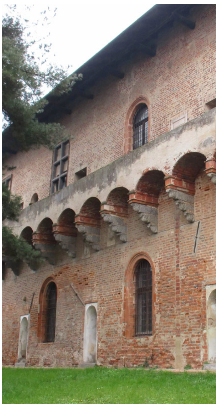
Il Castello di Mirabello