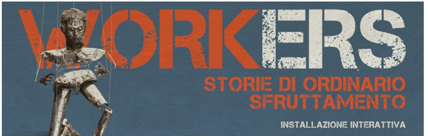
Particolare della locandina della installazione