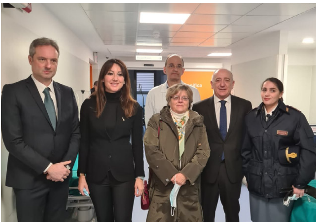
Un momento della visita al presidio di Polizia all'Ospedale di Voghera

nee punto a punto tra nosocomio e Forze di Polizia. «Questo presidio fisso dedicato alla prevenzione e alla sicurezza – ha affermato l'assessore Lucchini – sarà un efficace strumento di deterrenza e assicurerà un intervento immediato a tutela del personale sanitario e dei pazienti della struttura sanitaria. Non possiamo - ha proseguito l'esponente della giunta lombarda - tollerare aggressioni e violenze ai danni di medici e infermieri. Questo fenomeno risulta in preoccupante crescita e credo sia particolarmente odioso anche perché spesso coinvolge il personale femminile, per questo, le istituzioni centrali e territoriali devono saper garantire una risposta efficace come questa messa in campo a Voghera. In nostro personale sanitario deve poter operare con la massima serenità sia in corsia sia in Pronto soccorso, a tutela e nell'interesse di tutti i cittadini, specialmente i più fragili». In occasione della trasferta del prefetto De Carlini si è svolto al municipio di Voghera il Comitato Provinciale per l'Ordine e la Sicurezza Pubblica itinerante presieduto dal Prefetto di Pavia, presenti il sindaco, il presidente della Provincia, il questore, i comandanti provinciali dei Cara-