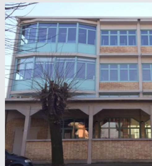
La biblioteca di Broni

Presto sarà affiancato anche da uno sportello di ascolto e sostegno psicologico, che oltre a tutte le informazioni dell'Informagiovani offrirà anche una consulenza psicologica gratuita ai cittadini sempre dai 15 ai 34 anni. Questo servizio servirà tutti i 48 comuni che fanno parte dell'Ambito distrettuale di Broni e Casteggio. Entrambe le attività saranno attivate in collaborazione con Fondazione Le Vele. «INforma: l'Oltrepò è dei giovani» è un progetto realizzato con il contributo di Regione Lom-