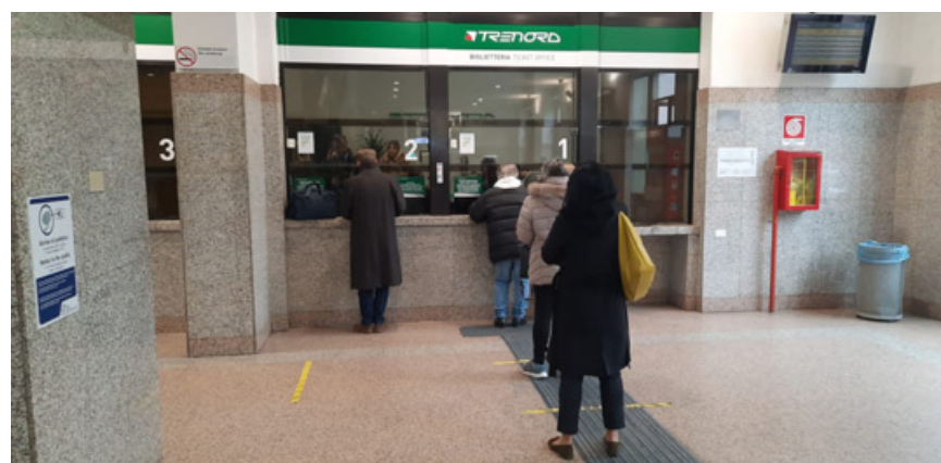
La nuova biglietteria a Pavia

BUROCRAZIA – Dal sito è possibile scaricare la documentazione