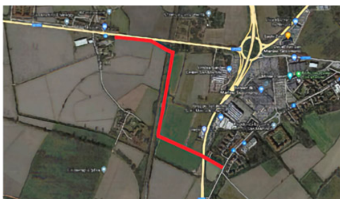
Il percorso della pista ciclopedonale

di San Martino Siccomario ha presentato il progetto di "Realizzazione tracciato ciclopedonale per il collegamento della località Santa Croce al centro abitato di San Martino". Spiega il sindaco: «Il progetto, presentato da San Martino, ha avuto un contributo pari a 416.040,76 euro dal Ministero a fronte di un cofinanziamento di 83.959,24 euro che dovrà garantire il comune. Un progetto dal quadro economico complessivo di 500.000 euro. Obiettivo: creare una pista ciclopedonale di collegamento tra il centro della frazione di Santa Croce e il comune di San Martino Siccomario. Il percorso del progetto si sviluppa per circa 1,2 km lungo la SP59, prosegue nelle campagne, sotto la ferrovia, attraverso un sottopasso e procede in direzione San Martino Siccomario, sempre attraverso le campagne. Il tracciato permetterà il collegamento in sicurezza dei due centri abitati e potrà essere utilizzato da ciclisti e pedoni, in entrambi i sensi di marcia. Il percorso è stato progettato rispettando le indicazioni dimensionali previste dalla normativa che disciplina le piste ciclabili, permettendo una percorrenza in entrambi i