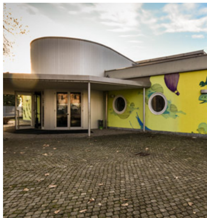
Il teatro Volta

L'oratorio è un punto di forza perché riunisce tutti i ragazzi, impegnandoli in attività sane, togliendoli dai muretti che spesso sono teatro di prassi poco edificanti, tipico quando non si hanno delle linee guida per impiegare il tempo. La presenza