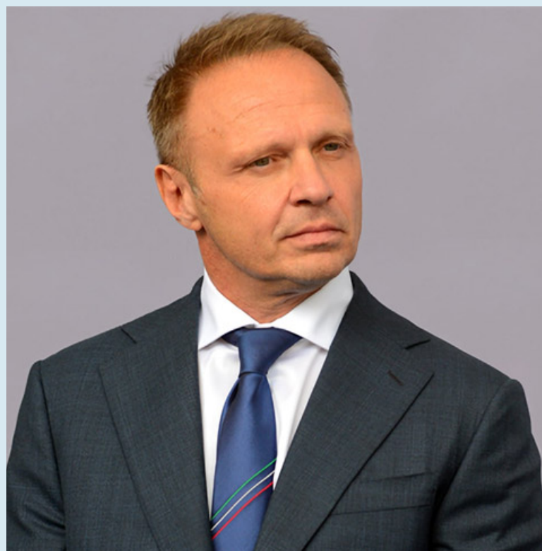
Il ministro Francesco Lollobrigida ha sbloccato un fondo da 76 milioni di euro per sostenere ristoranti, pasticceri e gelaterie