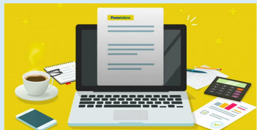
Dal sito delle Poste di possono ottenere tutti i documenti per l'Isee