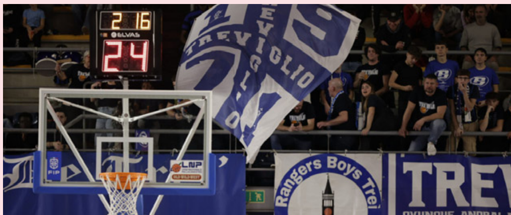
I tifosi del Treviglio non hanno mai smesso di tifare la propria squadra