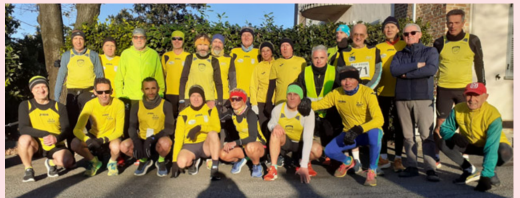
Gli atleti dell'Us Scalo