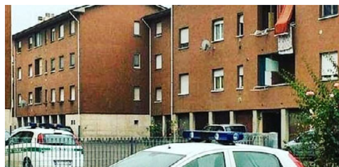
Case Aler a Voghera

euro ed in possesso dei requisiti di cittadinanza, residenza, situazione economica, abitativa e familiare specificati al punto 5 dell'avviso pubblico. La domanda può essere presentata per un'unità abitativa adeguata alla composizione del nucleo familiare del richiedente. Nella domanda possono essere indicate fino ad un massimo di due unità abitative adeguate alla composizione del nucleo familiare. La domanda va compilata dal richiedente esclusivamente in modalità telematica, accedendo alla piattaforma www.serviziabitativi.servizirl.it . Si può accedere con tessera Cns (Carta nazionale dei servizi), Cie (Carta d'identità elettronica) o Spid (Sistema pubblico di identità digitale). «L'amministrazione comunale conferma il proprio massimo supporto per arginare un problema delicato, rappresentato dalla crisi abitativa – sottolinea l'assessore ai servizi sociali Federico Taverna – Gli anni di emergenza sanitaria e la situazione critica dal punto di vista economico hanno inoltre messo a dura prova le famiglie più fragili, che hanno così aumentato le richieste di aiuto anche sul piano abitativo. I nostri uffici ri-