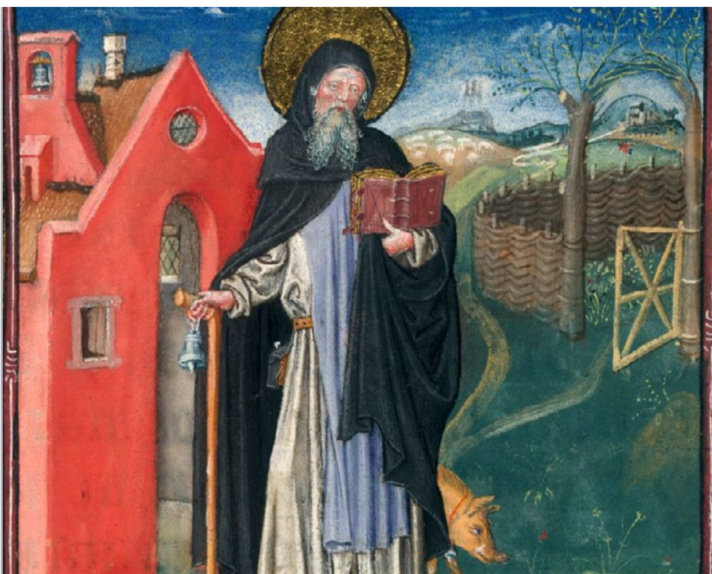
Sant'Antonio Abate in una miniatura con il maiale ai suoi piedi