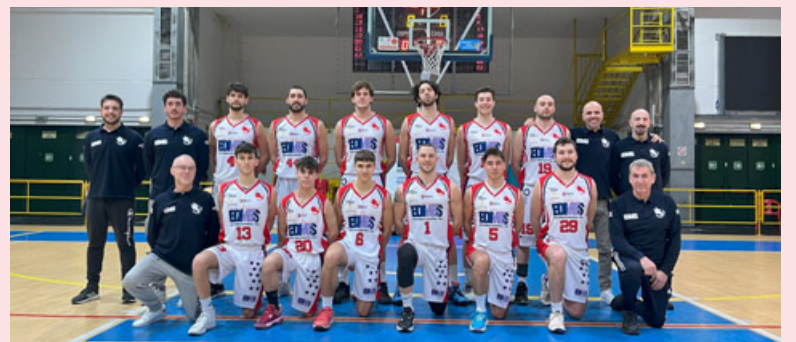
Il roster della Sanmaurense