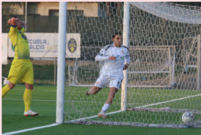
Il pallone in fondo alla rete dell’Oltrepò