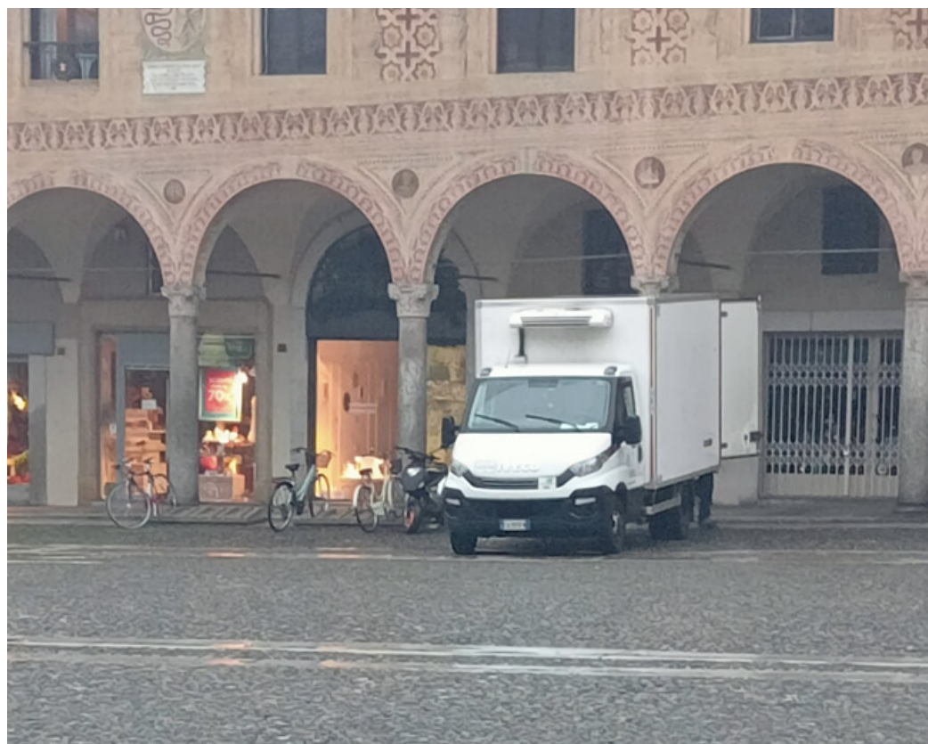
Solo il camion della «catena del freddo» potranno entrare

Dal 1° gennaio, gli agenti della polizia locale, posizionatisi sia in prossimità dei varchi di accesso della piazza, sia all'interno della stessa, hanno verificato che gli orari di carico e scarico fossero rispettati. Inoltre, hanno provveduto anche a fornire ogni tipo di informazione in merito