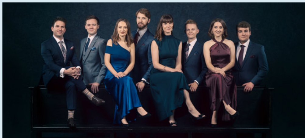
"London by Night" del gruppo Voces8 andrà in scena il prossimo