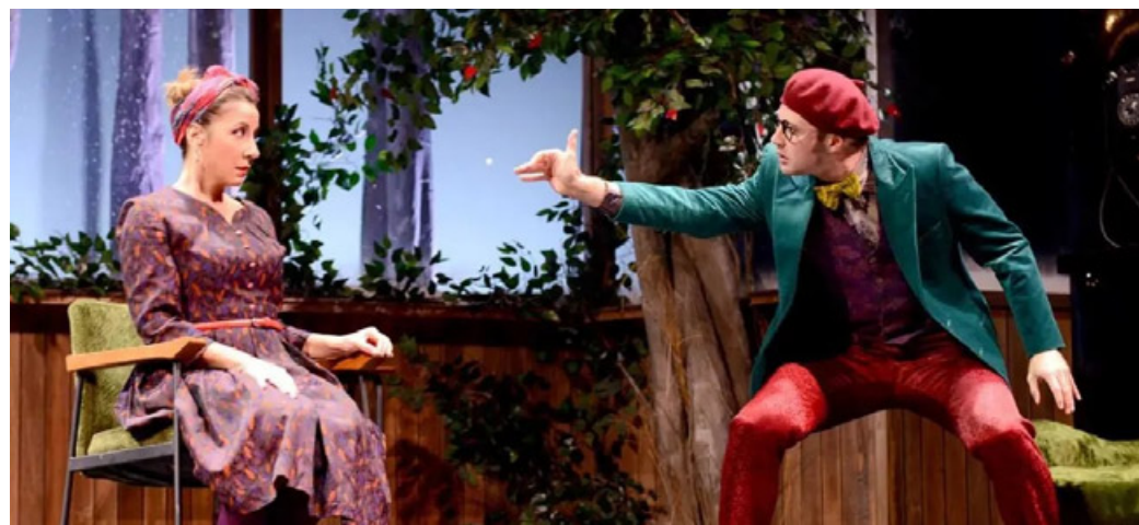
Un momento dello spettacolo