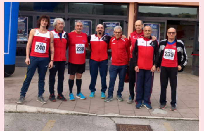
Alcuni dei partecipanti ai Campionati Italiani di Ancona

ACQUISTARE CASA ALL'ASTA FACENDO QUINDI UN AFFARE? NON HAI TEMPO DA DEDICARE ALLA PROCEDURA? PENSIAMO A TUTTO NOI, PER UN ASSISTENZA TOTALE DALLA RICERCA DELL'IMMOBILE AL DECRETO DI TRASFERIMENTO DEL BENE, CHIAMACI PER UN INCONTRO SENZA IMPEGNI, TI SPIGHEREMO TUTTO!!! CON LA POSSIBILITA' DI MUTUARE FINO AL 100% DELL'IMPORTO!