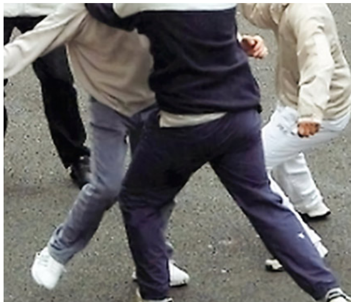
Troppe risse in centro, gli abitanti sono stanchi

INFRASTRUTTURE – Anas da il via all'appalto per la Tratta C sino ad Albairate