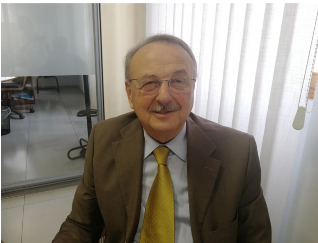
Il sindaco Enrico Vai

«È stato un anno abbastanza pesante va detto, sotto molteplici punti di vista. A livello di amministrazione, però, posso affermare senza timori di smentite che abbiamo sempre cercato di lavorare al meglio, per il bene della cittadinanza e di coloro che hanno riposto fiducia nella mia amministrazione. Sono stati portati avanti dei progetti e investimenti importanti. Per mezzo dei fondi Pnrr si è cercato di effettuare interventi di riqualificazione alla nostra scuola, soprattutto volti a introdurre dei sistemi che riducesero al minimo il consumo energetico. Considerando ciò che sta accadendo in questo periodo storico, puntare sul risparmio è da ritenersi fondamentale. Penso che proseguiamo sempre su questa linea anche nel corso dei prossimi mesi, almeno fino