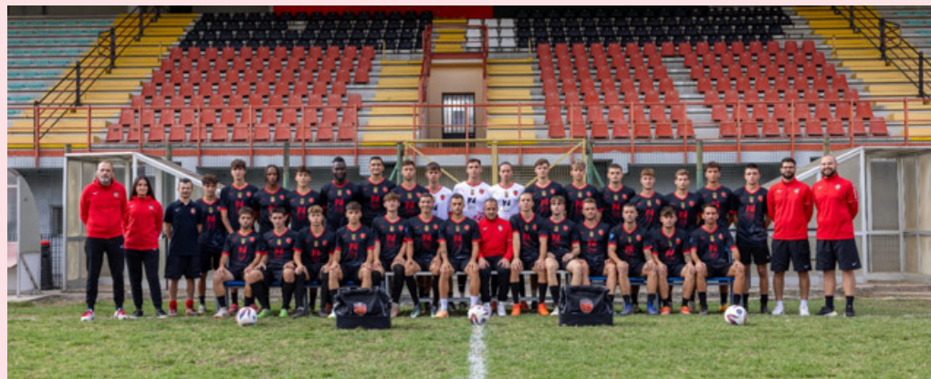
La rosa della vogherese al completo