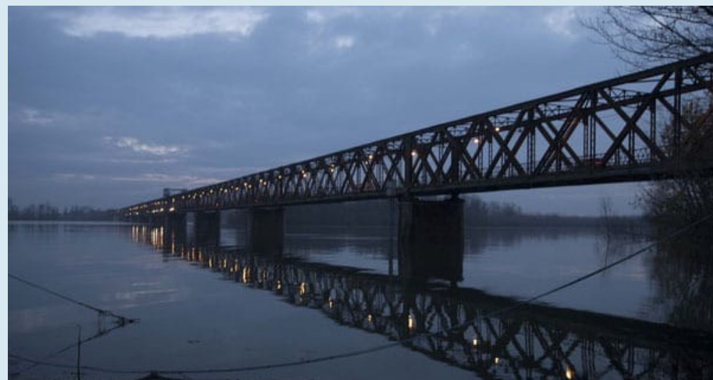
Regna ancora l'incertezza sul Ponte della Becca