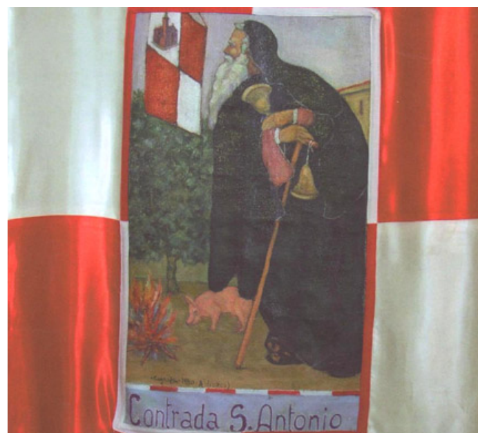
La chiesa di Sant'Antonio Abate e un particolare del gonfalone della contrada