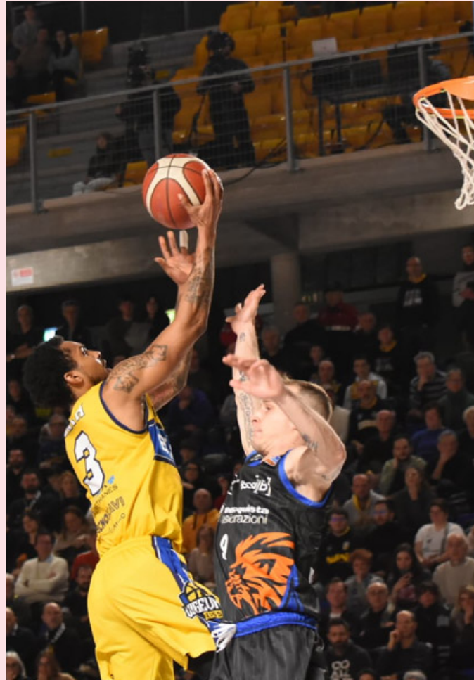
Smiths va a canestro contro il latina

Nell'ultimo quarto la partita si accende ulteriormente e preval-