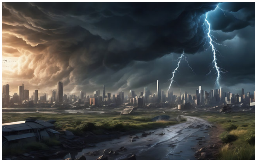
I cambiamenti climatici e i fenomeni meteorologici estremi fanno paura agli italiani

Le sfide globali che più sembrano preoccupare i cittadini sono quelle relative ai cambiamenti climatici e perdita della biodiversità (indicata da 7 italiani su 10), al timore per l'aumento di situazioni di violenza e conflitti (indicata da 7 italiani su 10), e alla diffusione di malattie e peggioramento dello stato di salute (indicata da 1 italiano su 2).