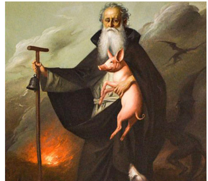
Tradizionale falò per Sant'Antonio che lo si ritrova anche nelle immagini votive dedicate al Santo

Cambia la caldaia alla tua spesa ci pensiamo noi