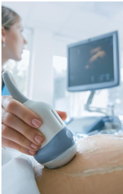
Vigevano ha strumenti all'avanguardia

L'Ostetricia dispone di un servizio di ecografia di altissimo livello, offre la partoanalgesia epidurale nell'arco delle 24 ore e il rapporto tra ostetriche e pazienti è di uno a uno. Il record delle nascite,