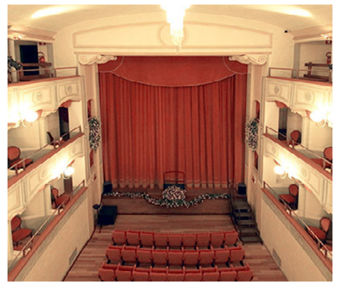
Il Teatro Martinetti ospiterà la festa della Fidal di Pavia

vedrà la presenza dei vertici dell'atletica e delle autorità civili che interverranno per le premiazioni. R.S.