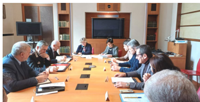
Tavolo provinciale per la sicurezza

C'è dunque pieno appoggio e disponibilità ad aumentare il li-