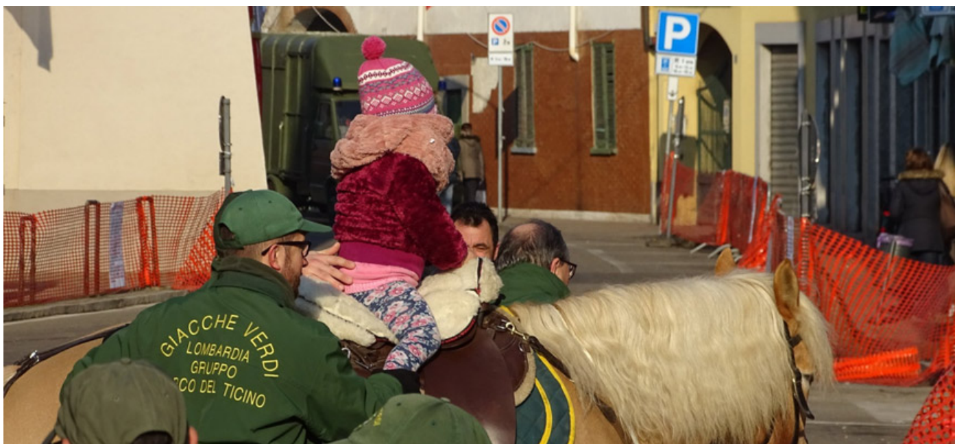
Il battesimo della sella per i bambini

È il protettore del mondo agricolo e degli animali e a festa a lui dedicata è pronta a tornare a fare compagnia con una serie di eventi e appuntamenti a lui dedicati. A Casorate è tutto pronto per la festa di Sant'Antonio Abate, con la Contrada che si è data da fare per allestire al meglio tutti i preparativi. «Questa è una festa molto importante – fanno sapere dalla contrada di Sant'Antonio – che rappresenta per Casorate Primo un elemento di vanto e anche un momento di riflessione. L'auspicio è che questi eventi possano avvicinare quanti più giovani e ragazzi possibili. Vogliamo che questa edizione riscontri successo tanto quanto ne hanno avuto quelle scorse». Prima di vedere da vicino cosa riserva il calendario, va detto che la XXV edizione della Stracasorate, la tradizionale corsa podistica legata alla festa di Sant'Antonio è stata rinviata a data da destinarsi. Questo a causa delle misure di restrizione che sono ancora presenti per limitare e ridurre al minimo la diffusione della peste suina. La festa in-