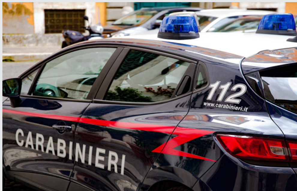
La Compagnia dei carabinieri di Stradella ha effettuato il fermo

tenzioni a sfondo sessuale ha trovato il coraggio di esternare tutto e ha parlato con i propri genitori; essi, appena venuti a conoscenza della situazione, hanno immediatamente sporto denuncia ai carabinieri e sono subito incominciate le indagini. La ragazza è stata sentita da uno psicologo e in seguito sono stati eseguiti degli accertamenti da parte dell'Arma; come sono stati ottenuti i primi riscontri il Gip ha firmato il mandato d'arresto e sono scattate le manette pochi giorni fa; ora il 35enne ha ottenuto i domiciliari.