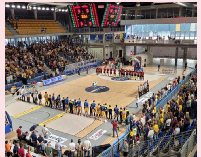
Il Palaelachem prima dell'incontro