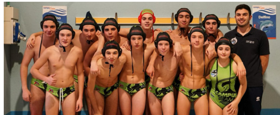
L'Under 15 di pallanuoto

toria di misura contro H2O Muggiò Rossa (9 - 7) e Viribus Unitis Verde (8 - 4); l'Under 22 purtroppo ha perso contro Onda Blu Dalmine (4 - 25) e Team Lombardia Rho (3 - 13). L'Under 22, squadra di recente creazione, al contrario delle altre, sta invece ancora combattendo per trovare un proprio equilibrio, sebbene la nuova compagine stia dando prova di grande impegno. G. B.