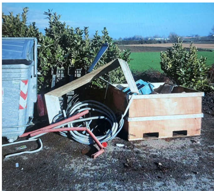
I rifiuti abbandonati dietro il centro commerciale Voghera Est