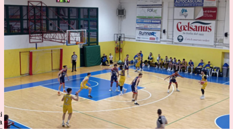
La Riso Scotti vincente a Gazzada