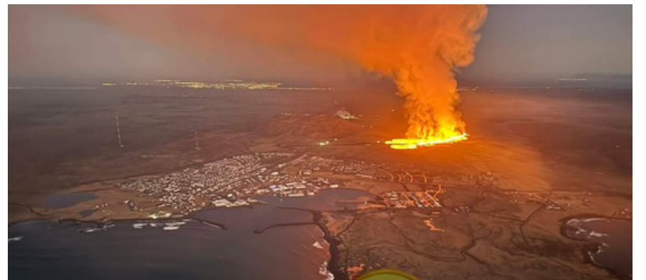
Alcune spettacolari immagini dell'eruzione in Islanda

nord. Dalla fessura la lava sta colando verso la zona residenziale. Dopo la prima scossa sismica la località è stata evacuata e non c'è pericolo per le persone. «Questo è lo scenario che temevamo di più, la lava in pros-