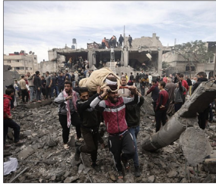
Cento giorni di guerra con poche prospettive che finisca presto

relativa sicurezza la parte nord dell'enclave palestinese. Il ministero della sanità retto da Hamas ha aggiornato il bilancio degli uccisi nella Striscia a oltre 23mila morti. Israele non si ferma e, secondo quanto rilevato da Wall Street Journal ma negato da fonti egiziane, avrebbe avvisato il Cairo che ha in programma un'azione militare per mettere sotto controllo la parte sud di Gaza al confine con