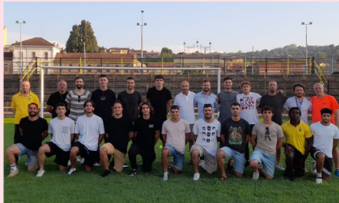
In foto la rosa 2023-2024 dell'Apos Stradella