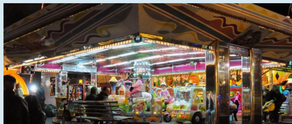
In foto, una giostra del luna park in Piazza Trieste a Stradella

cillarsi al banco predisposto alla vendita di dolci e leccornie varie. Il parco ultimato e certificato sarà fruibile per i visitatori da giovedì 7 settembre, dalle ore pomeridiane fino alle 24. Il venerdì seguente, invece, sarà aperto dalle 9 alle 12,30 e dalle 15 alle 24. Sarà identico l'orario di domenica 10, mentre il sabato chiuderà mezz'ora dopo (a mezzanotte e mezzo). Il lunedì finale vi si potrà accedere dalle 9 alle 12,30 e dalle 15 alle 19.