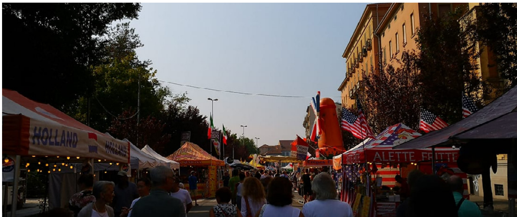
Il mercato europeo in una foto di repertorio dell'edizione 2018

Torneranno le bancarelle enogastronomiche più ghiotte e variegate, con specialità provenienti da tutto il mondo. Come sempre, ci saranno ospiti internazionali e nazionali con l'obiettivo di valorizzare la bella Italia e allo stesso tempo di 'fare amicizia' con la gastronomia di altri Paesi, un modo per viaggiare pur rimanendo a casa. Ci saranno i classici rivenditori di palloncini per far divertire i bambini, bolle di sapone e molto altro. Questi momenti uniscono la voglia di uscire a quella di sentirsi in una zona confortevole dove l'intera cittadinanza sente di essere parte di una grande famiglia che ha voglia di incontrarsi mentre assaggia qualcosa di tipico, non importa la provenienza, degustando una buona birra da asporto, e, si sa, nello Street food è tollerato bere la