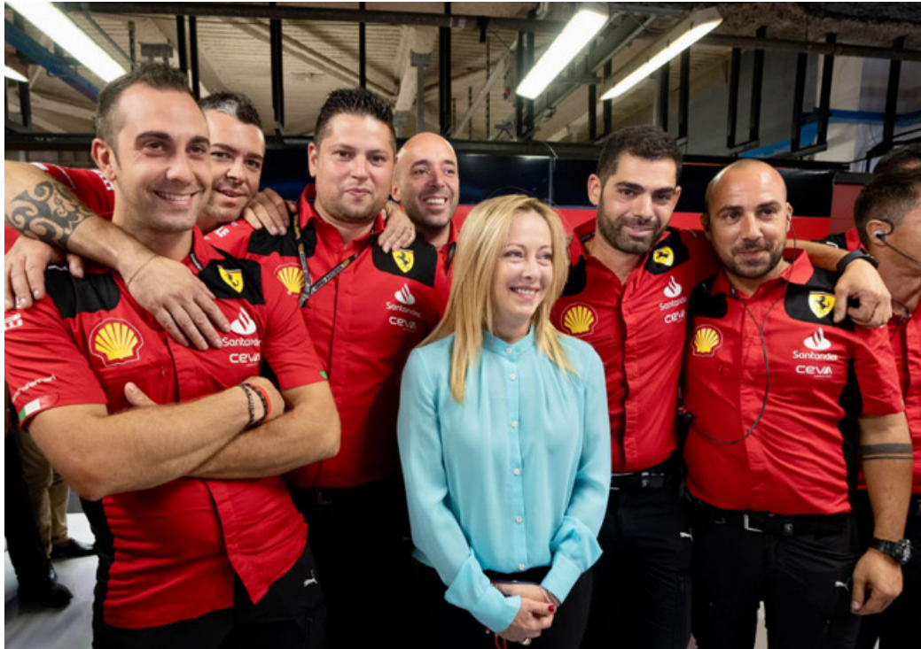
Giorgia Meloni all'autodromo di Monza: "Dobbiamo correre di più per far correre la nazione"

Sceglie un'immagine che si sposa perfettamente con la visita all'autodromo di Monza. "Dobbiamo correre di più per far correre questa nazione ed avere fortuna", sostiene Giorgia Meloni. La premier pensa ai dossier sul tavolo, quelli che la terranno occupata durante la ripresa di settembre e nei prossimi mesi: manovra, giustizia, presidenzialismo su tutti. La presidente del Consiglio interviene prima del Gran premio, dove incontra anche Barbara Berlusconi, fermandosi a conversare con lei. Non si mostra invece al Forum Ambrosetti, il tradizionale appuntamento di Cernobbio lasciando che sia il ministro dell'Economia Giancarlo Giorgetti a chiarire quali saranno le direttrici entro cui si muoverà l'azione del governo in campo economico. Ma la premier sa perfettamente che se la manovra dominerà la scena fino alla fine dell'anno, i dossier caldi su cui bisognerà mettere d'accordo Forza Italia e Lega non sono meno importanti. E un primo appuntamento per testare l'umore degli alleati sarà il ver-