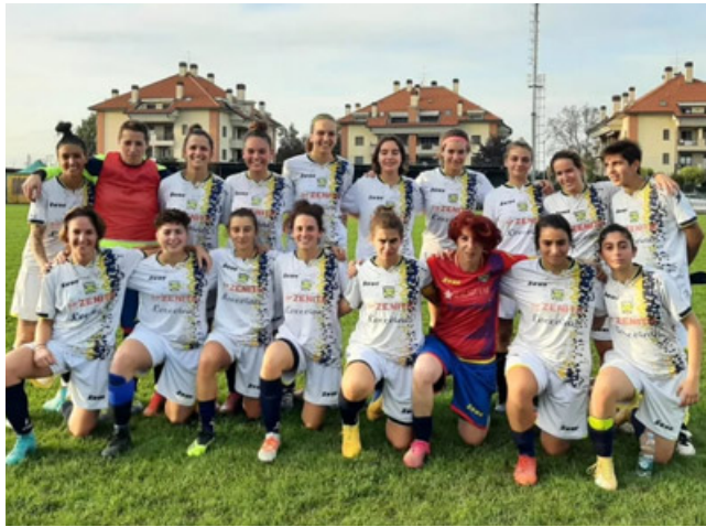
In foto la Womem Rivanazzanese