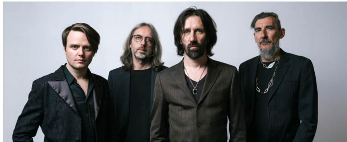
Mercoledì 6 settembre al Castello si esibirà il gruppo rock italiano Marlene Kuntz