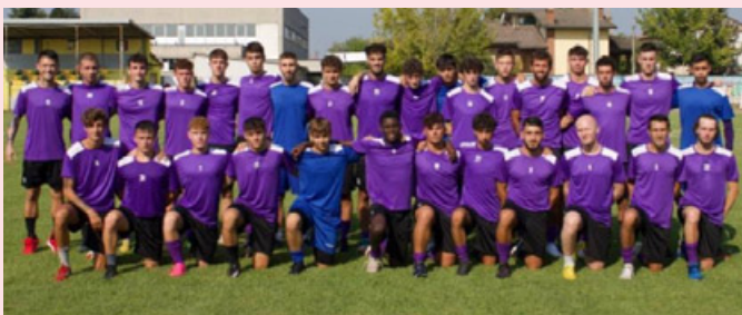
L'Union Calcio Basso Pavese: rosa 2023-2024