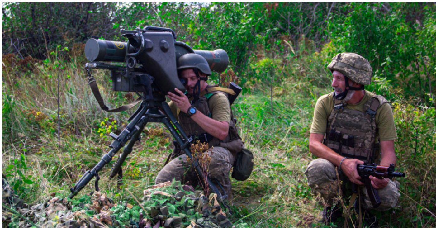
L'Ucraina avanza verso sud e consolida le posizioni sempre più vicine a Zaporizhzhia.

Anche se con qualche difficoltà la controffensiva ucraina avanza soprattutto nel sud del Paese, dove ormai sono molte le conferme che le truppe di Kiev hanno rotto la prima difesa russa nei pressi di Zaporizhzhia e adesso si trovano in direzione delle seconde linee di Mosca. Tutto bene, dunque? Sì ma anche no, visto che proprio per rafforzare l'avanzata, Zelensky silura il ministro della Difesa Oleksii Reznikov, in odore di corruzione, sostituendolo con un fedelissimo, il capo del Fondo del demanio statale Rustem Umerov. Ferita, ma tutt'altro che doma, la Russia continua a prendere di mira i porti ucraini da cui partono le spedizioni di grano. L'esercito russo ha rivendicato di aver colpito quello di Reni sul Danubio, nella regione di Odessa, al confine non solo con la Moldavia ma anche con la Romania, un Paese Nato. Da Bucarest fanno sapere di ritenere ingiustificati i raid, mentre la presidente moldava Maia Sandu ha condannato il brutale attacco e chiesto di ritenere Mosca "responsabile per ogni infrastruttura distrutta". Secondo molti analisti il Cremlino sarebbe rimasto sorpreso dai successi di Kiev sul fronte meridionale, anche perché il