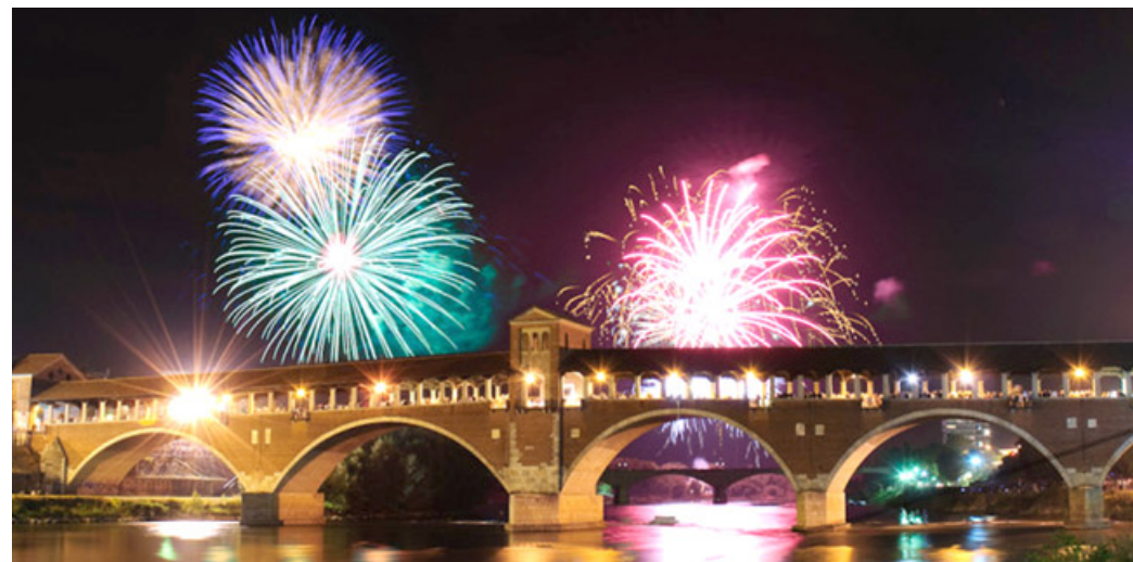
Domenica 10 settembre dalle ore 22:30 spettacolo pirotecnico dall'area Vul