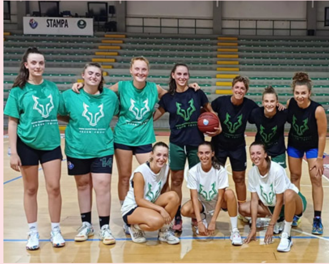
In foto la rosa 2023-2024 della Broni Basketball Academy

La formazione oltrepadana debutterà in campionato sabato 23 settembre alle 20,30 sul campo dell'Edelweiss Albino. Il debutto casalingo è invece previsto per il 30 settembre tra le mura amiche del Palaverde Gianni Brera di Broni dove sarà ospite la formazione bresciana del Ponteviso. Una stagione complicata quella