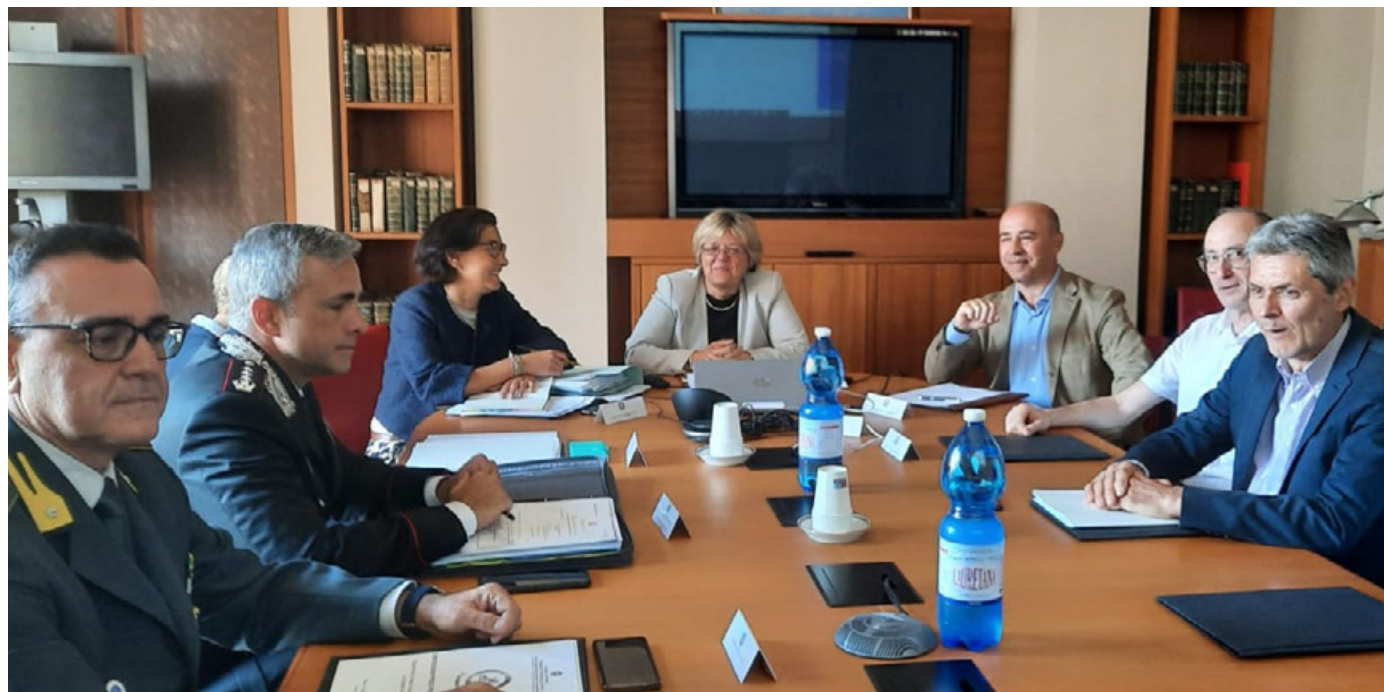
Il Comitato Provinciale per l'Ordine e la Sicurezza Pubblica riunitosi in settimana a Pavia

Prevenzione e contrasto alla illegalità, interventi sanitari e di accompagnamento sociale, ripristino e recupero degli immobili di proprietà pubblica e privata in stato di abbandono. Sono le tre direttive dettate dal prefetto di Pavia Francesca De Carlini, nel corso dell'ultimo Comitato Provinciale per l'Ordine e la Sicurezza Pubblica svoltosi a Palazzo Malspina in settimana. L'obiettivo dichiarato è quello di contrastare il fenomeno delle occupazioni abusive, anche estemporanee, delle numerose strutture di proprietà pubblica e privata dismesse e spesso fatiscenti, presenti sul territorio. Durante l'incontro svoltosi a nel capoluogo pavese al quale hanno partecipato a fianco del Prefetto di Pavia, i vertici delle forze dell'ordine, il vice dirigente del Compartimento della polizia ferroviaria della Lombardia e, in due diversi momenti, il sindaco e il comandante della Polizia locale di Pavia, nonché il sindaco, l'assessore alla Sicurezza e il comandante della Polizia locale di Voghera, è stato avviato il cronoprogramma delle attività, a