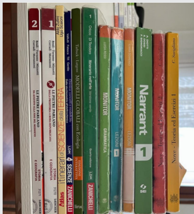
Scambiarsi i libri di testo, una soluzione a caro scuola