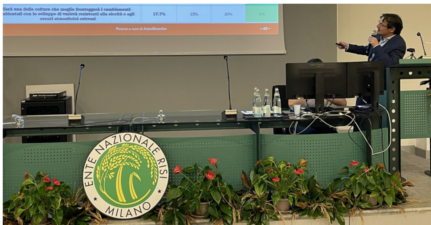
A Castello d'Agogna, l'Ente Nazionale Risi ha presentato una ricerca sulle abitudini alimentari degli italiani