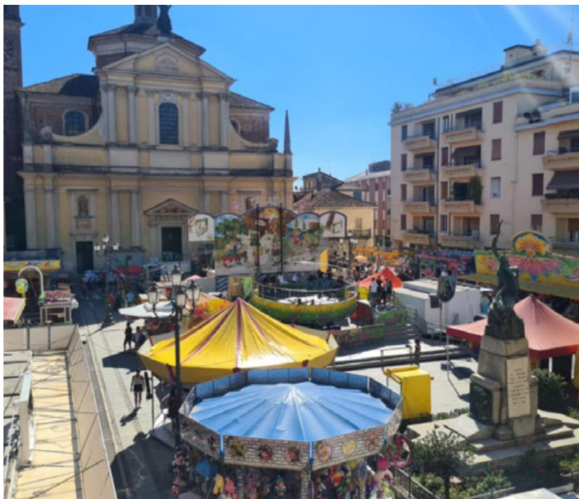
A sinistra le giostre in piazza di fronte alla chiesa parrocchiale della Beata Vergine Assunta; a destra i The Revangeles si esibiranno sabato 9 settembre

Garlasco si appresta a vivere nuovamente la festa della Beata Vergine Assunta, uno dei momenti più significativi e rappresentativi della città. Essa si svolge ogni 10 settembre, accompagnata da una serie di eventi che si tengono nei giorni che precedono e seguono la festività. In particolare, chiunque lo desidererà, potrà assistere a eventi di musica live, concerti, esibizioni di cover band, dj set con musica dance italiana e internazionale e a serate danzanti, potrete apprezzare importanti mostre fotografiche e artistiche e potrete prendere parte alle degustazioni di tante prelibatezze, come risotti, arrosticini e molto altro ancora. Sarà inoltre possibile passeggiare tra le tante colorate bancarelle della Fiera d'Autunno situate nella piazza principale del paese, e gustare le tante proposte gastronomiche, dallo street food ai prodotti artigianali, o fermarvi ad acquistare pezzi di antiquariato. Per i più piccini, ogni anno viene allestito il tradizionale Luna Park con animazione, giostre, giochi e tanto divertimento.