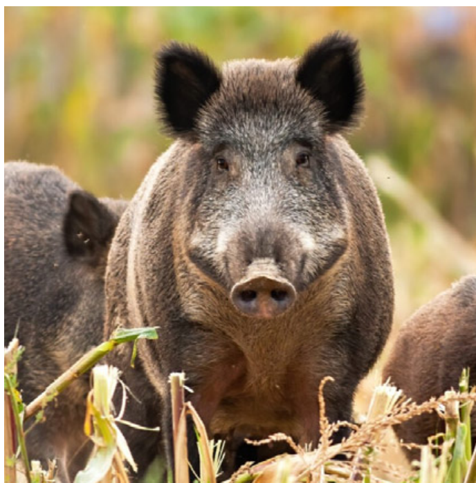
L’Ue valuta misure drastiche per fronteggiare l’epidemia