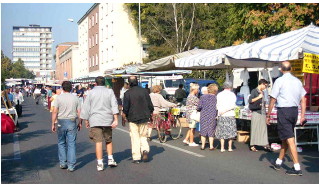
La Festa del Ticino in un'immagine di repertorio

Oggi la Festa del Ticino per oltre due settimane animerà la città di Pavia con l'ultimo grande appuntamento della stagione estiva, tra bancarelle, musica, arte e spettacoli. Broletto, Piazza Italia, il Castello Visconteo, Strada Nuova, il Ponte Coperto, Borgo Ticino, il Ticino stesso e tanti altri luoghi caratteristici della città, ospiteranno presti-