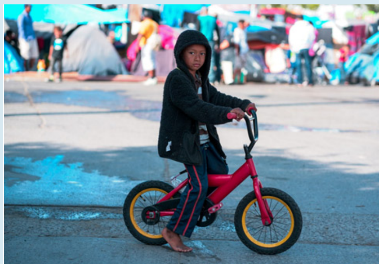
Le regioni che ne accolgono di più sono Sicilia e Lombardia