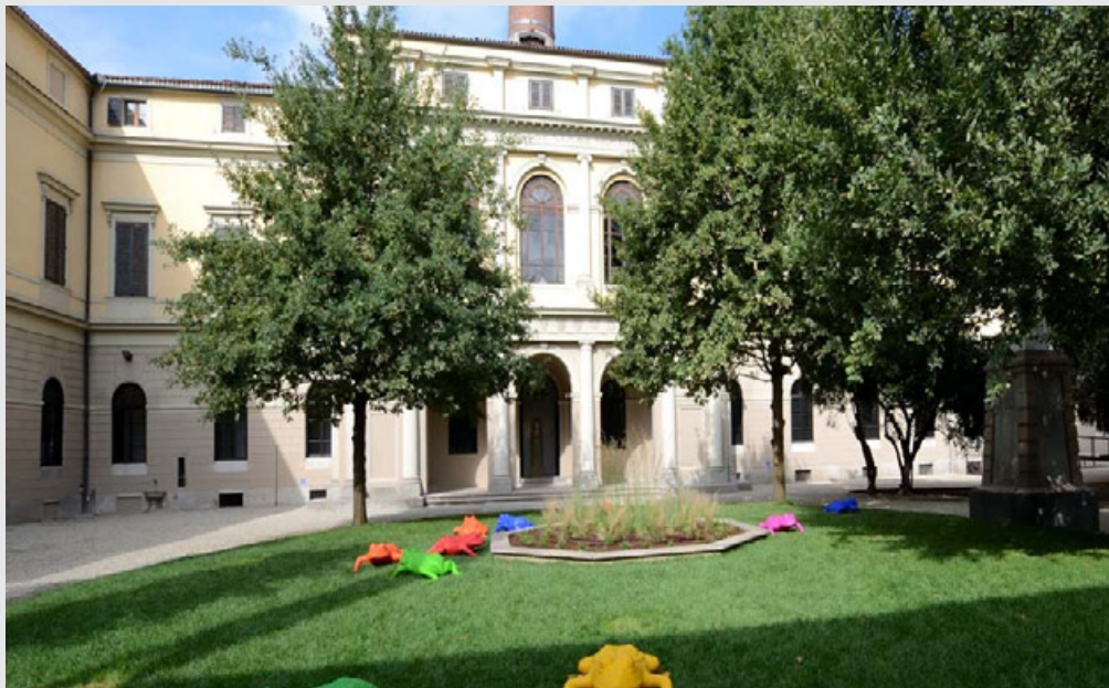
Il museo Kosmos si integrerà con il futuro museo dedicato alla storia della medicina