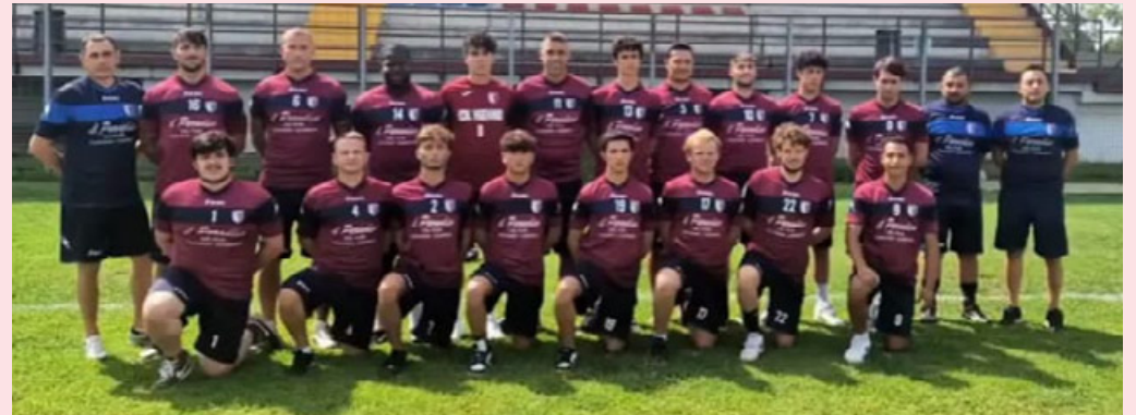
In foto la rosa 2023-2024 del Gambolò

NUOTO – Il 10 settembre giornata di specializzazione con i campioni azzurri Marco Orsi e Alessandro Calvi