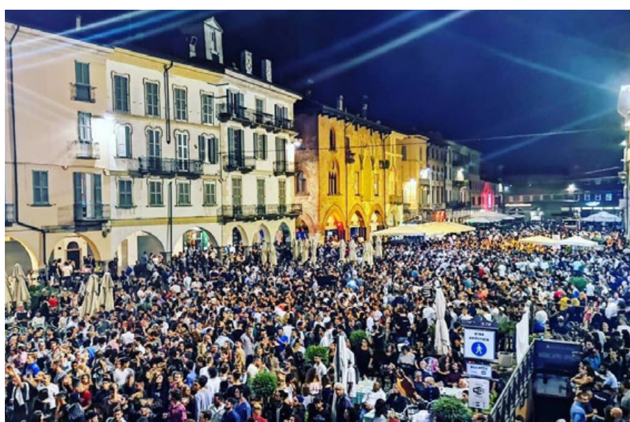
La notte bianca sarà animata dal loggiato del Broletto da Dj set pavesi. A destra, un'immagine della notte bianca del 2018

avranno tanto lavoro". Alcuni sono ancora in forse, e magari ci faranno la sorpresa, quello che è certo è che i bar rimarranno aperti almeno fino alla mezzanotte, che sia la piazza o gli assi principali. L'osservazione che è arrivata da quasi tutti è che c'è stato un gap di comunicazione notevole e inaccettabile per una città come Pavia, laddove qualcuno ha sot-