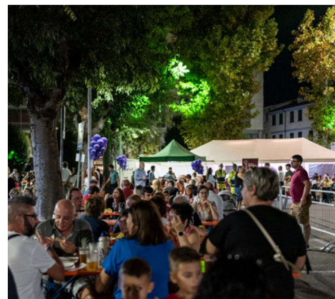
Broni: uno scatto della Festa dell'Uva 2022

C'è grande attesa per il ritorno dell'evento che celebra uno dei prodotti simbolo delle terre dell'Oltrepò Pavese. La Festa dell'Uva, in programma a Broni per questo fine settimana, promette di intrattenere a suon di cibo e divertimento. Le giornate in programma sono quelle dell'8, 9 e 10 settembre 2023. Insomma, per tutto il weekend i partecipanti alla rassegna potranno assistere a un buon numero di iniziative. Il venerdì sarà a sfondo prevalentemente sportivo. Alle 18,30, l'attenzione si concentrerà sulla presentazione della squadra di calcio dell'Asd Oltrepò Fbc e quella di basket femminile dell'Asd Broni 2022. All'apertura della kermesse seguirà la giornata di sabato, quando dalle ore 11 si svolgerà l'incontro con il giornalista Paolo Massobrio. L'evento, intitolato Che personaggi nel mondo del vino! sarà un resoconto dell'esperienza vitivinicola dello scrittore, con ricostruzioni di storie e aneddoti