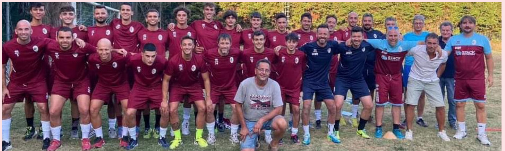
In foto il Varzi: la nuova rosa 2023-2024

BANCA MEDIOLANUM TI CIRCONDA DI ATTENZIONI