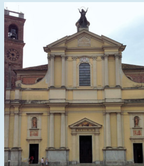
La chiesa parrocchiale della Beata Vergine Assunta

La Chiesa della Beata Vergine Assunta è uno dei luoghi più emblematici e significativi della città. La chiesa parrocchiale, dedicata alla Beata Vergine Assunta e a San Francesco, sorse su progetto dell'architetto Gerolamo Regina di Pavia a partire dal 1715 in luogo della più antica chiesa di Santa Maria intra muros, edificio di cui rimangono tracce nell'area absidale e alla base del campanile. La costruzione si prolungò fino alla consacrazione del 1783. La facciata, ultimata nel 1831, è a due ordini sovrapposti, raccordati da volute e scanditi da quattro coppie di colonne doriche nella parte inferiore e due coppie di colonne corinzie nella superiore. L'accesso alla chiesa è affidato a tre ingressi principali, sormontati da pannelli ornamentali in ceramica. L'interno si articola