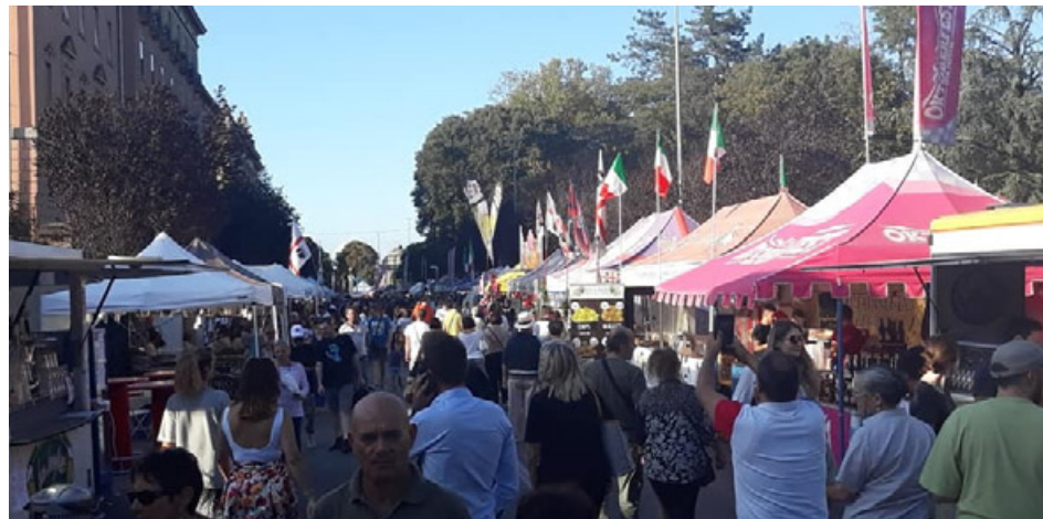
Il mercato europeo di viale Matteotti sarà aperto dal 7 al 10 settembre