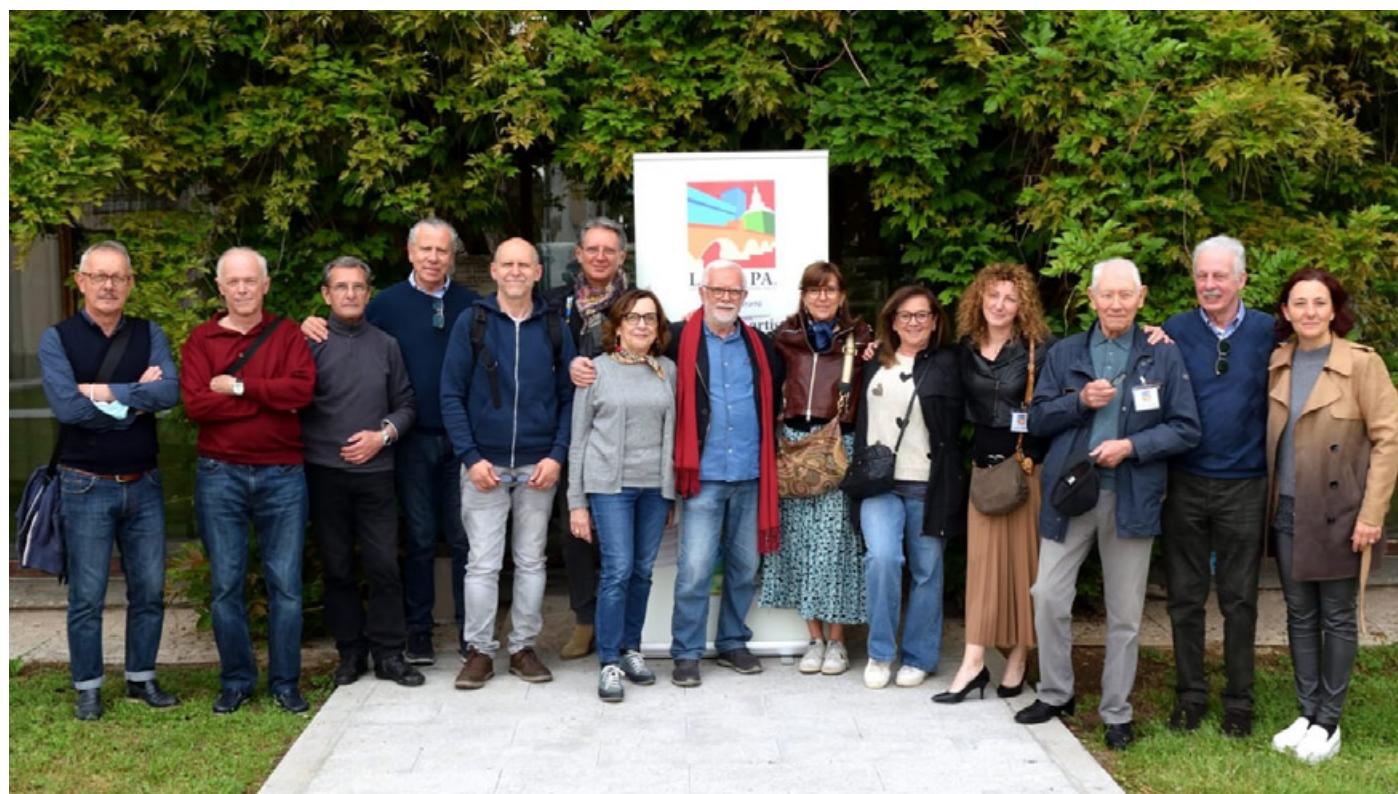
Alcuni degli artisti de L.a.p.i.pa Liberi Artisti Pittori Illustratori Pavese durante una recente mostra a Borgarello

Nel 1965 su idea di giovani artisti locali nasce la Libera Associazione Pittori Pavese. Essi crearono un nucleo indipendente scervo da condiziona-