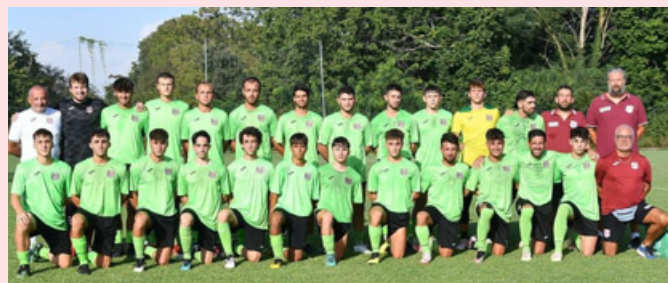
La rosa 2023-2024 della Cavese