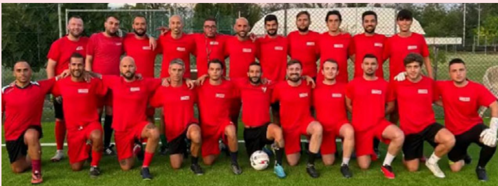
In foto la rosa 2023-2024 del Retorbido