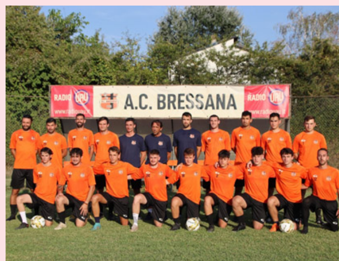
In foto la rosa 2023-2024 del Bressana