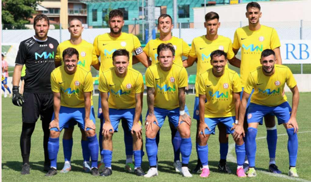
In foto l'undici dell'Oltrepò