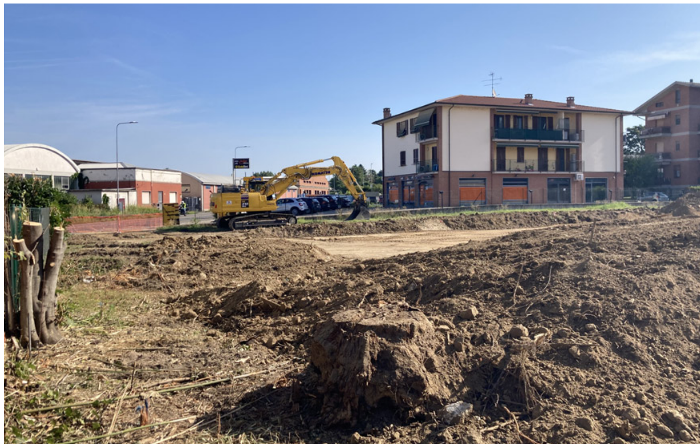
In foto, i lavori per la realizzazione del nuovo parcheggio funzionale al polo sanitario bronese

Le strutture sanitarie bronnesi godranno a breve di un nuovo parcheggio pubblico. È questo l'intento dell'amministrazione, che ha già visto iniziare i lavori che porteranno alla realizzazione. Si tratta di un'area di grande importanza strategica (nello specifico, quella compresa tra via Galileo Ferraris e via Circonvallazione), con cui si dovrebbe finalmente risolvere l'annoso problema del posto auto, che negli ultimi anni aveva causato difficoltà di non poco conto negli spostamenti per chi deve recarsi presso la Casa di Comunità. La messa a punto prevede l'inserimento di 86 posti riservati ai veicoli a motore: 76 saranno per le auto (di questi, 55 per gli utenti delle strutture sanitarie e 21 per i dipendenti socio-sanitari), mentre i restanti 10 si riserveranno ai motocicli. Posteggi ed edifici saranno collegati tra loro grazie ad appositi corridoi pedonali che faciliteranno il transito delle persone. Così facendo, si garantirebbe l'accesso diretto all'ex strada statale 10 Padana Inferiore dei mezzi di soccorso dell'Areu (Agenzia Regionale Emergenza Urgenza). Ma non solo: tutti gli edifici all'interno dell'ex ospedale Arnaboldi ne dovrebbero beneficiare. Parliamo degli ambulatori, tra cui quello per la lotta al mesotelioma, e gli sportelli della Casa di Comunità in via Emilia, che si attesta da poco anche come centro per le cure palliative. L'intervento del sindaco bro-