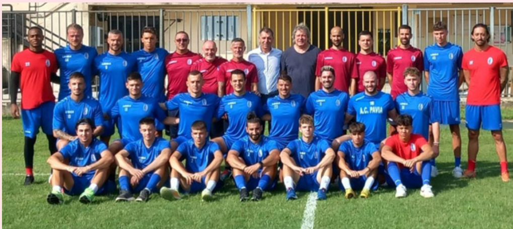
In foto la rosa 2023-2024 del Pavia