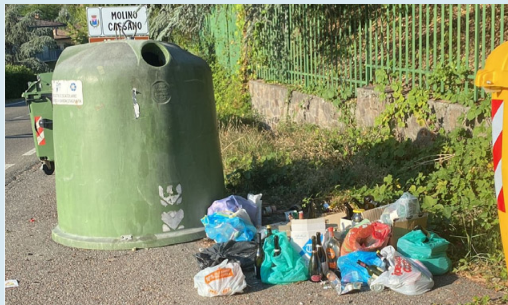
Uno dei tanti cassonetti presi di mira dai vandali e dagli incivili